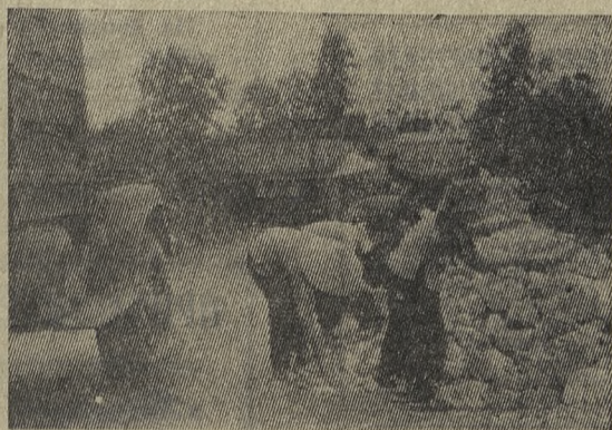
Дороги ДРВ. День и ночь по ним идут колонны машин со всеми необходимыми для жизни и борьбы грузами.

Пока не завершён ремонт дороги, здесь иногда образуются «пробки». Девушки из строительной бригады топят расчищать путь от камня (на снимке). Через несколько минут машины смогут пройти.