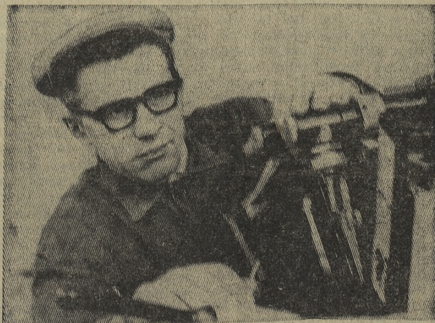
■ НА КОНКУРС: «КОММУНИСТЫ, ВПЕРЕД!»

Чтобы облегчить решение этой задачи, бюро горкома партии на прошлом заседании утвердило ряд практических мероприятий. Предусмотрено, в частности, на каждом опорном пункте выделить дружинников специально для индивидуальной профилактической и воспитательной работы в микрорайонах и кварталах. 180 человек нужно для этого, а 52 — для работы нештатными участковыми инспекторами. Это уже большая и реальная сила, способная резко улучшить деятельность дружин и опорных пунктов. Необходимо партийным организациям предприятий подойти к отбору таких людей серьезно. Намечены меры, чтобы ликвидировать и другие недостатки. Как это сделать? Первоуральцам есть полный резон воспользоваться опытом работы Новополюцкой городской партийной организации по укреплению правопорядка и усилению борьбы с правонарушителями. Опыт проверен на практике, оправдал себя. Используйте его, можно превратить Первоуральск в город высокой культуры и образцового правопорядка.