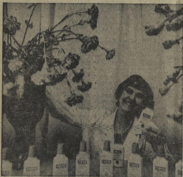
Рига. Благодаря чудесному препарату «Нора», срезаемые цветы сохраняют свежесть и привлекательность в течение 3—4 недель. Продлить жизнь цветам удалось сотрудникам Ботанического сада Академии наук Латвийской ССР.