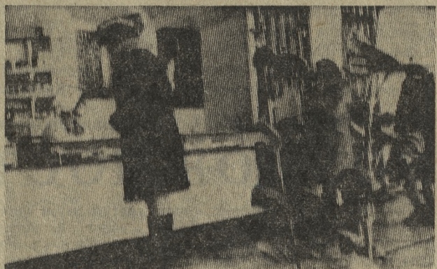
За последние годы материально-техническая база учреждений здравоохранения значительно окрепла. На снимке: в аптеке по проспекту Космонавтов.

Многое предстоит сделать городскому, сельским и поселковым Советам Первоуральска, их исполнительным органам, для того, чтобы выполнить все, что намечается сделать во втором году пятилетки. Депутатам в этой работе отводится огромная роль. Советские люди, горячо и единодушно одобряя намеченную XXV съездом КПСС социально-экономическую программу развития страны, полны решимости воплотить эту программу в жизнь. Подтверждение тому — широкий размах социалистического соревнования за успешное выполнение заданий пятилетки. Долг депутатов, исполкомов Советов всемерно поддерживать это патристическое движение, активно участвовать в нем.