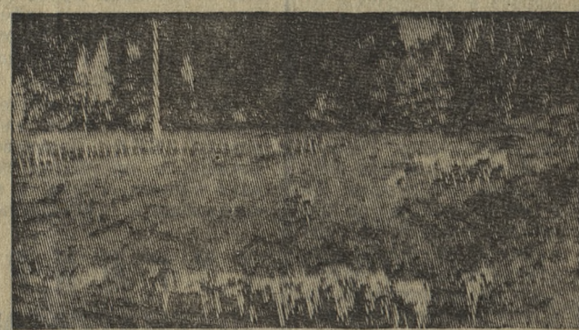
В объективе — Новая Зеландия