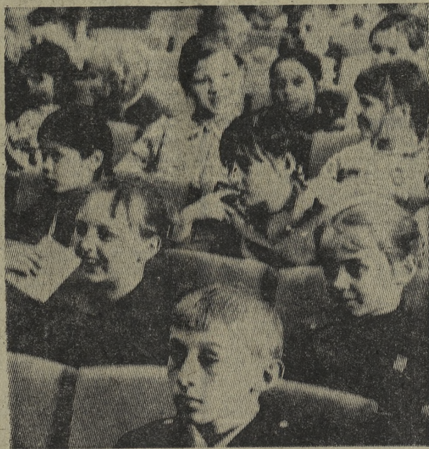
На детском спектакле.

стских секций на местах, рекомендаций, ответил на недостаточная пропаганда вопросы. Участники конференции избрали новый состав совета городского туристского клуба «Меридиан» в количестве 19 человек. Потом рассмотрели два любительских кинофильма, снятых Альфредем. Он подробно рассказал о развитии туризма Полярному Уралу и Байкалу в нашей области, дал ряд лу-