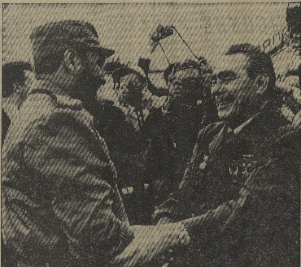
ГАВАНА. Январь 1974 года. Официальный дружеский визит в Республику Куба Генерального секретаря ЦК КПСС Л. И. Брежнева. На снимке: во время встречи в аэропорту «Хосе Марти».

Демичев, Б. Н. Пономарев, М. С. Соломенцев, И. В. Капитонов, В. И. Долгих, М. В. Зимянин, К. У. Черненко, Я. П. Рябов; с кубинской стороны — товарищи К. Р. Родригес — член Политбюро ЦК Компартии Кубы, заместитель Председателя Государственного совета и Совета Министров Республики Куба, В. Эспин — член ЦК Компартии Кубы, член Государственного совета Республики Куба, С. Агирре дель Кристо — член ЦК Компартии Кубы, посол Республики Куба в СССР. Товарищи Р. Кастро и Л. И. Брежнев обменялись речами.