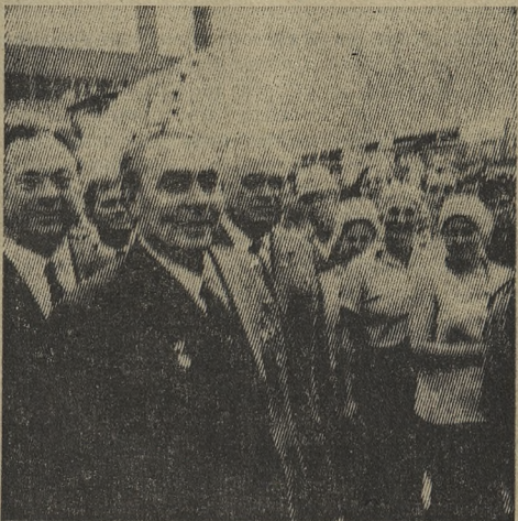
НОВОРОССИЙСК. Сентябрь 1974 года. Генеральный секретарь ЦК КПСС Л. И. Брежнев посетил цементный завод «Пролетарий».