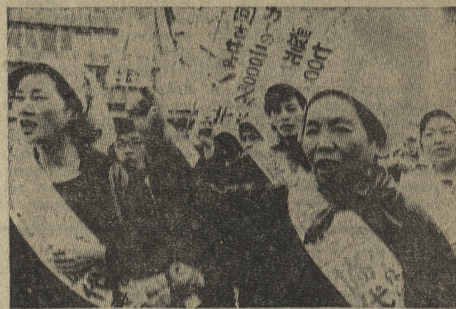
Минувшая осень ознаменовалась в Японии небывалым размахом классовой борьбы. По всей стране прокатилась мощная волна выступлений трудящихся в защиту своих прав жить и работать.

На снимке: демонстрация токийских домохозяек, протестующих против роста дороговизны.