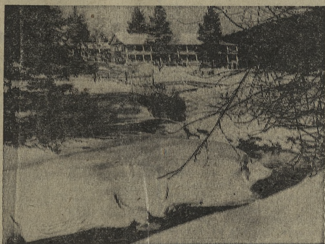
Лыжная база «Бодрость» — одно из тех мест, где новотрубники охотно проводят свои выходные дни.