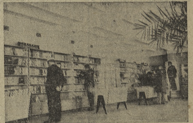
В книжный магазин № 125 часто заходят любители книги.