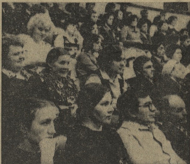
ГОРОДСКОЕ ТОРЖЕСТВЕННОЕ СОБРАНИЕ, ПОСВЯЩЕННОЕ ВСЕСОЮЗНОМУ ДНЮ РАБОТНИКОВ СЕЛЬСКОГО ХОЗЯЙСТВА