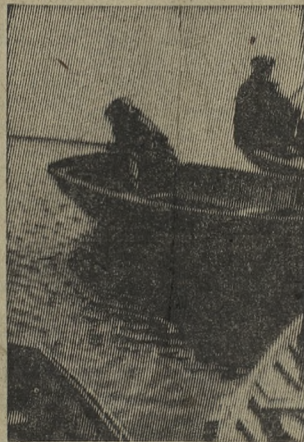
В ожидании поклевки.

И. МИСТИШЕВА, инструктор ГАИ по профилактике дорожных происшествий и детского травматизма.