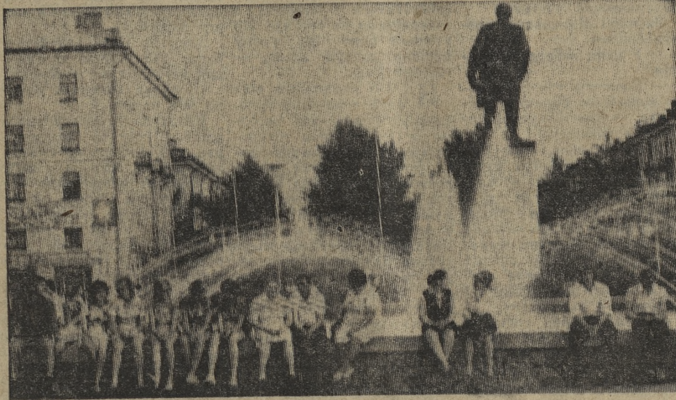
У фонтана в погожий сентябрьский день.