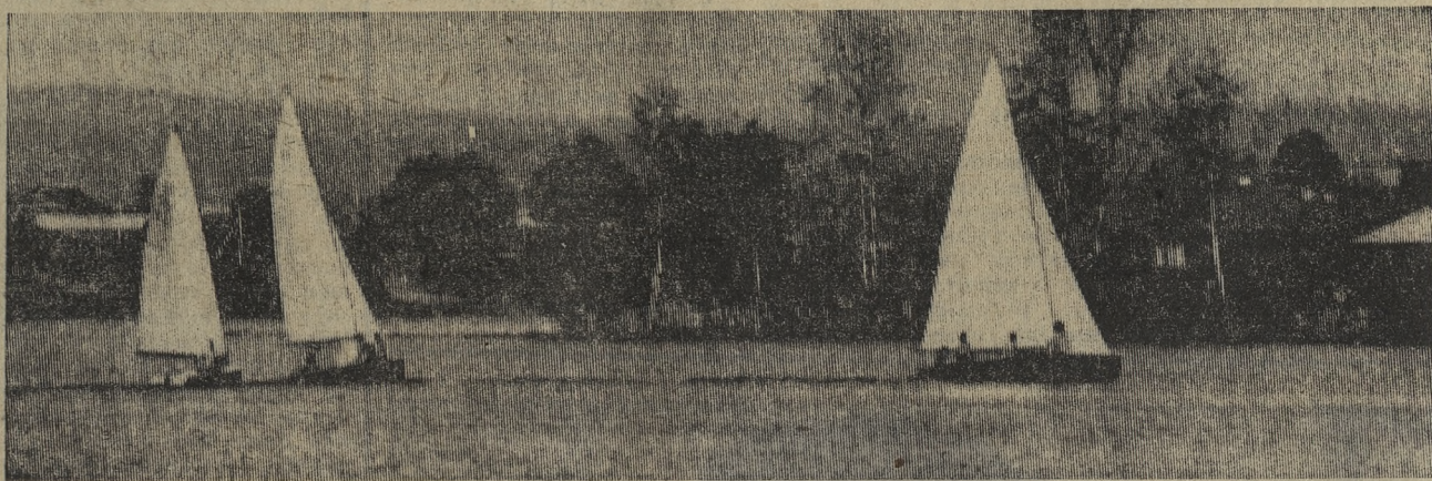
Яхты на нижнем пруду.