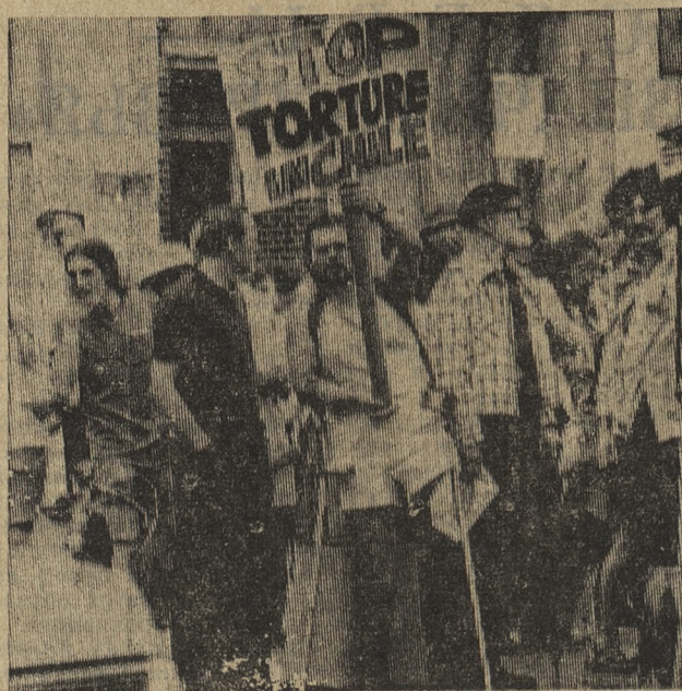
■ В ЗАЩИТУ ПАТРИОТОВ ЧИЛИ