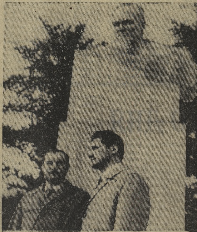
На снимке: экипаж космического корабля «Союз-21» — командир корабля летчик-космонавт СССР Б. В. Волинов и бортиженер В. М. Жолобов у памятника С. П. Королеву.

Доброотно отремонтированные и подготовленные во всех отношениях базы и складские помещения — залог длительного качественного хранения картофеля и овощей, нормального снабжения ими первоуральцев в течение многих месяцев. Поэтому ход работ на этих объектах должен быть постоянно в поле зрения партийных и профсоюзных организаций горпищеторга, треста столовых, райпо.