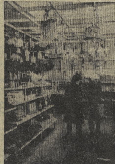
В «верном» жилище новотрубники, предусмотрен и комплекс по обслуживанию населения. В него входит, в частности, современный хозяйственный магазин. НА СНИМКЕ: в отделе электротоваров.