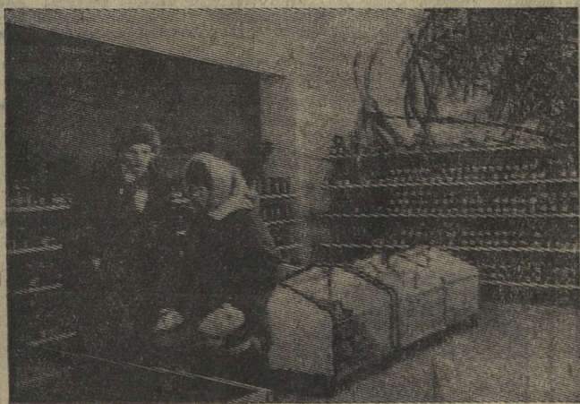
В новом продовольственном магазине в седьмом микрорайоне. Расположился этот магазин в «всерном» комплексе.