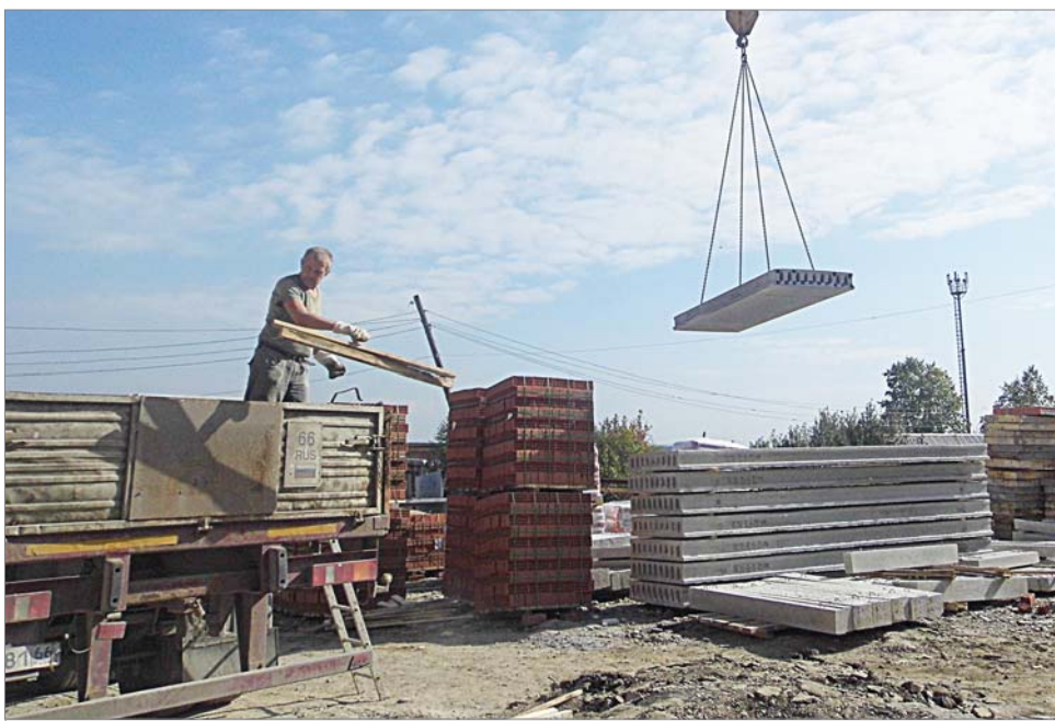
Привезли плиты перекрытий.