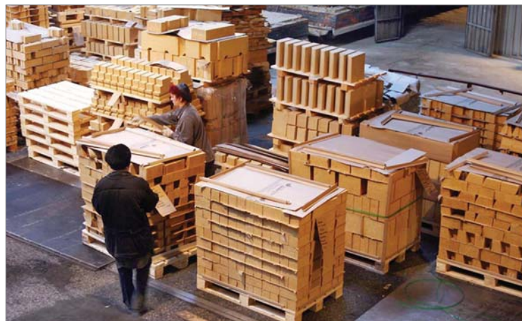
В сентябре-2007 коллектив «ДИНУРА» выполнил заказ для Здешовице.

Сентябрь-2007 — тоже важная «экспортная» веха. Выполнен заказ для Здешовице. Это уже пятая батарея, которую польские коксохимики строят из ди-