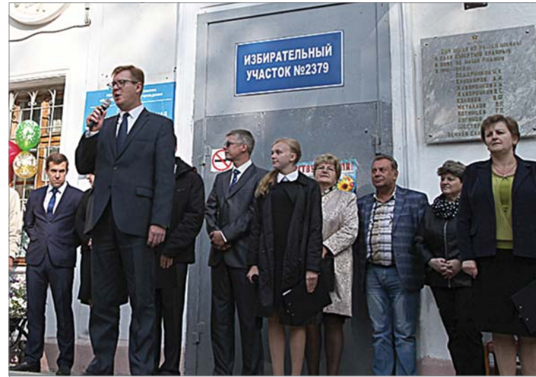
С поздравлением в школу №15 приехал Игорь Кабец.

Занятия начались в 24-х городских школах. За парты сели 17780 ребят, 2070 из них — первоклассники. Капитальные ремонты нынче проведены в 4-х учебных заведениях, текущие — в 7-ми . Всего на ремонт школ в 2018 году затрачено 82,4 миллиона рублей.