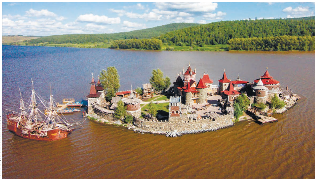
С высоты, где летают орлы и прочие пернатые, вид на «Сонькину лагуну» очень даже завлекательный

Развлекательный центр «Сонькина лагуна» — один из самых разрекламированных турпродуктов. Его еще называют «уральский Диснейленд». Еще бы, антураж средневековья, пиратский остров с неординарным названием «Дупло орла». И все — на Южном Урале, в небольшом городке Сатка. Звучит очень заманчиво и выгодно отличается на фоне привычных предложений, как провести свободное время.