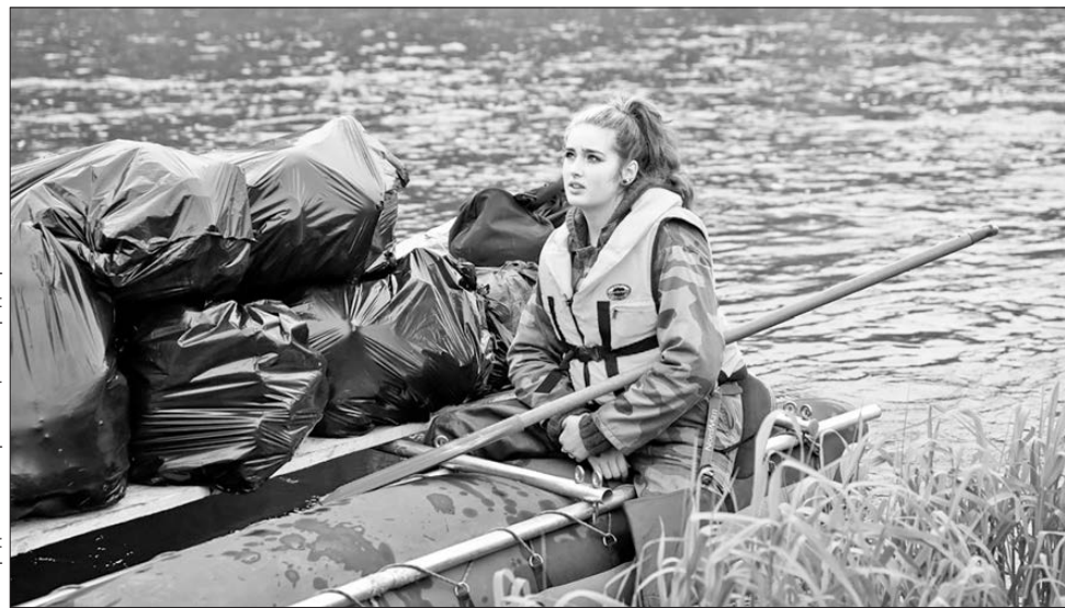
С берегов Чусовой активисты собрали несколько десятков мешков мусора

Начиная с середины июня общественная организация «Город первых» занимается экологическими вопросами Первоуральска. Сейчас на ее счету уже несколько масштабных акций, таких, как экосплавы по Чусовой. А в планах на ближайшее будущее, например – восстановление родников и оживление Билимбаевского пруда.