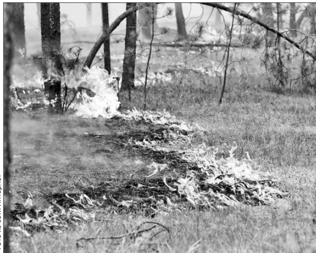
На территории Билимбаевского лесничества произошло 15 пожаров

— Понятно, что никто не хочет специально поджечь лес сигаретой, но у никотинозависимых есть привычка машинально выбрасывать спички или окурки в сторону. Не будем забывать, что они еще и вооружены зажигалками. А из искры и в самом деле может возгореться пламя... Особенно опасно курить в хвойных лесах. Там мало зеленой травы и днем сильно под-