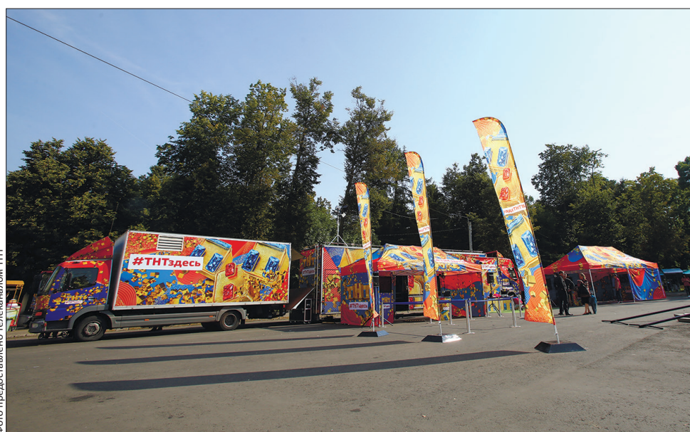
С собой команда ТНТ привозит и гримерку, и съемочный павильон, и монтажную студию

А уж в каком качестве с их помощью «засветиться» на экране, решать вам. Благо, выбор будет богатым. Конечно, самый лакомый кусочек – это сняться в эпизоде любимого сериала, развлекательного шоу или ролике со звездами канала. А нужно для этого всего ничего. Прийти, захватив с собой паспорт, зарегистрироваться на площадке ТНТ, заполнить согласие на использование своего изображения для эфира и пиара (дети до 14 лет принимают участие в съемках только с разрешения родителей), получить порядковый номер и выбрать одну из сцен сериала, шоу или ID-ролик. Затем как самый настоящий актер вы пройдете на грим, дождетесь вызова на площадку и, войдя в кадр, начнете выполнять команды режиссера. Весь отснятый материал будет выкладываться в официальную группу ТНТ «ВКонтакте», чтобы каждый мог поделиться с близкими и друзьями.