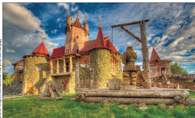
Один из «узников» замка