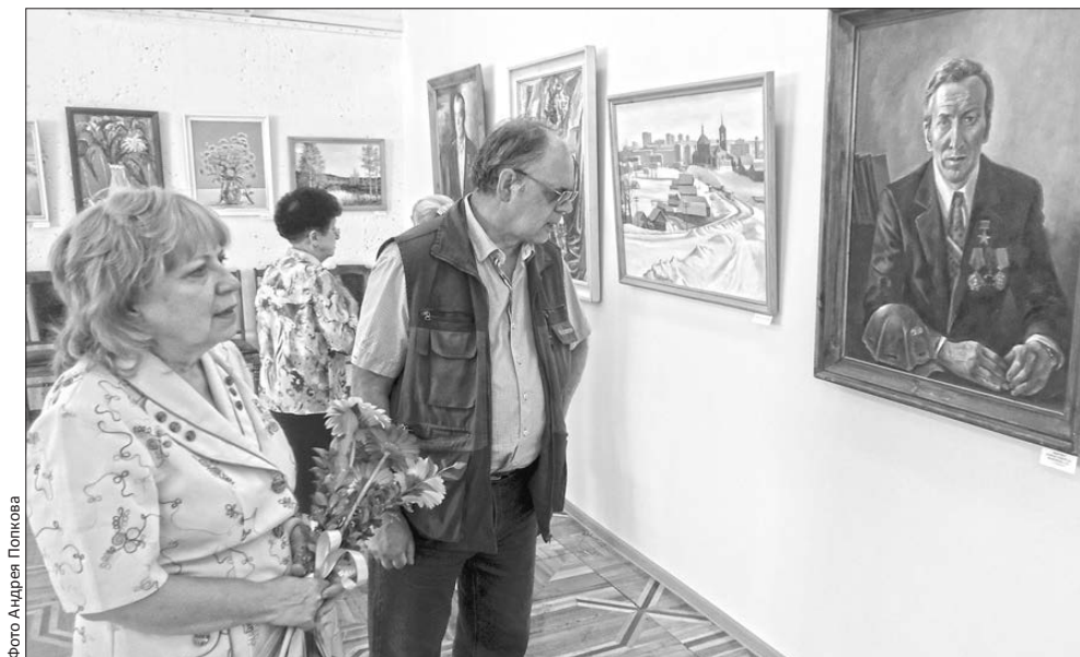
На юбилейную выставку приходили с букетами цветов

12 июля Музей истории ПНТЗ отмечает 45-летие. К значимой дате из запасников музея извлекли картины-раритеты за последние несколько десятков лет. Сейчас они выставлены в экспозиции «Вехи славной истории» — уже пятой по счету выставке, приуроченной к юбилею музея.