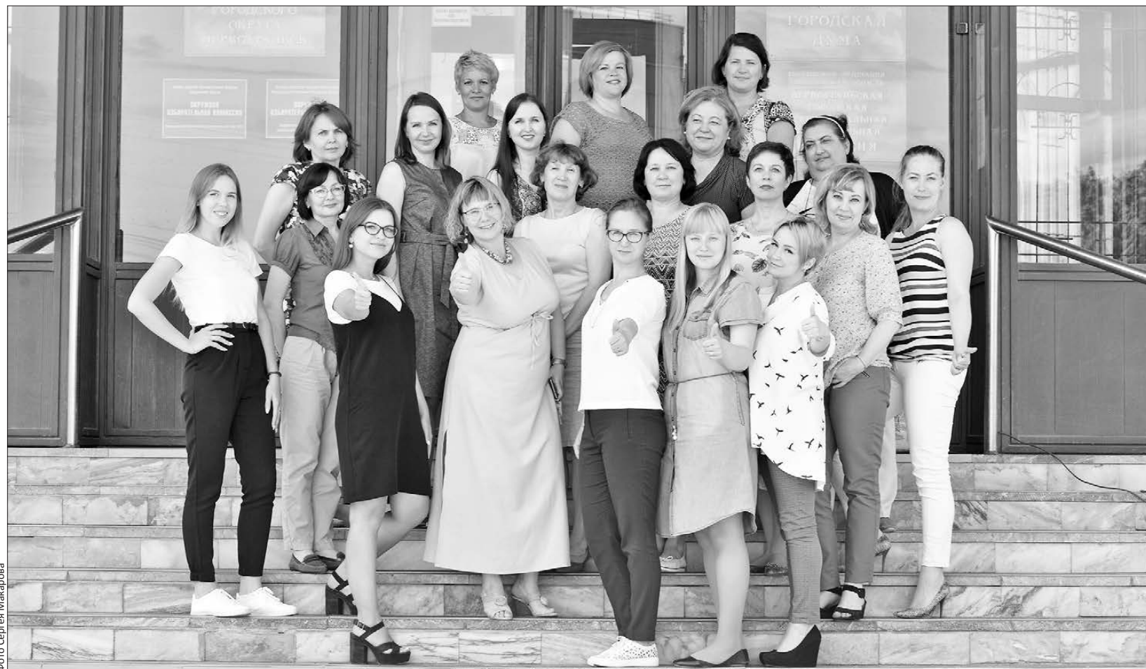
Коллектив финансового управления администрации городского округа Первоуральск сегодня

— От профессионализма наших городских финансистов зависит своевременность и обоснованность принятия муниципального бюджета — основного финансового документа городского округа. Поэтому хочу пожелать терпения, достойного материального эквивалента вложенному труду и стабильности — в стране и в нашем городе! Чтобы все было хорошо у вас в семье, тогда ничего не помешает всецело отдаваться любимому делу.