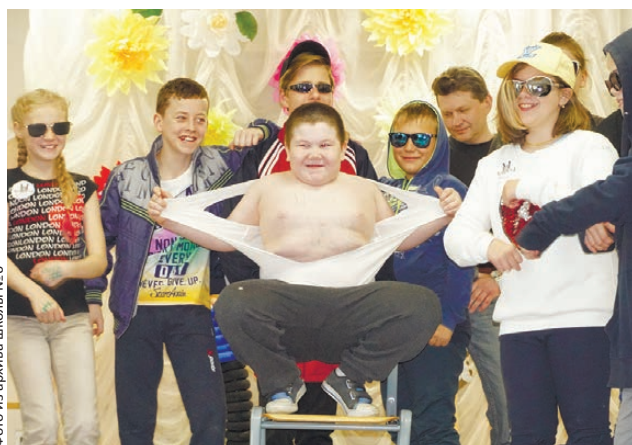
Фото из архива школы №6