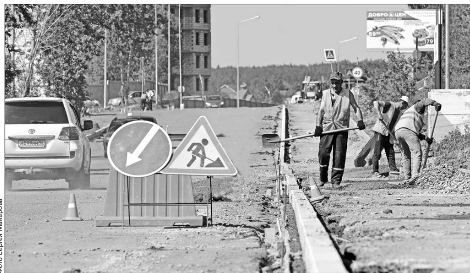
По плану саму дорогу закончат к 1 сентября

Сейчас работы идут на участке дороги в начале Береговой, у супермаркета «Первый». Туда с инспекцией прибыли заместитель главы ад-