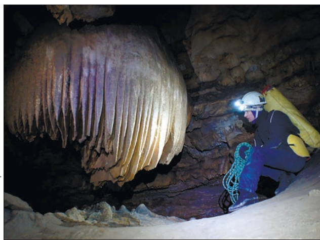
Зал Бороды: можно смотреть часами

— Но и без Летучего голландца здесь есть на что по-