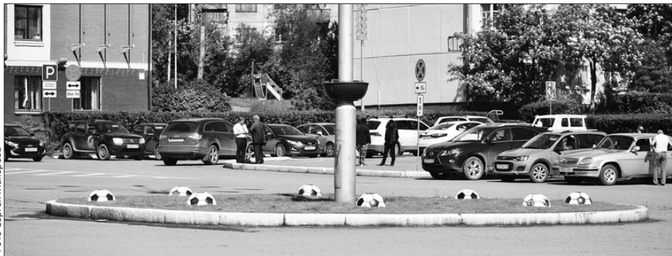
Не успела наша сборная победить в матче с египтянами, как следующим же утром количество мячей уже обновилось до восьми

Чемпионат мира по футболу-2018 — в самом разгаре. Вся страна следит за играми с особым интересом, и приложила к этому руку, а точнее, ногу наша сборная. Тем временем в Первоуральске это решили отметить художественной акцией: футбольные полусферы одна за другой стали вырастать в самом центре города — по числу забитых нашими головами.