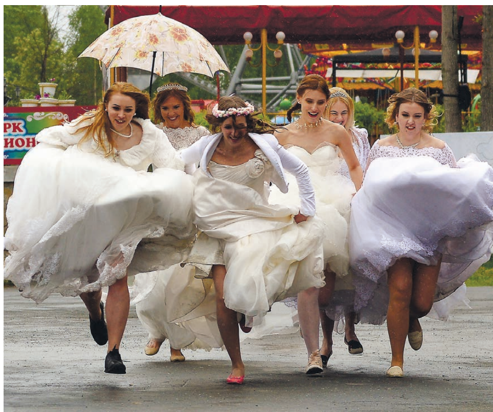
Посторонись, невесты бегут!

Возможность «выгулять» свадебный наряд первоуралочки получают вот уже четвертый год подряд. «Парад невест» в этом году поменял локацию – с городской набережной переместился в Парк новой культуры. И то ли поэтому, то ли из-за растущей с каждым годом популярности, собрал почти в четыре раза больше участниц, чем прежде.