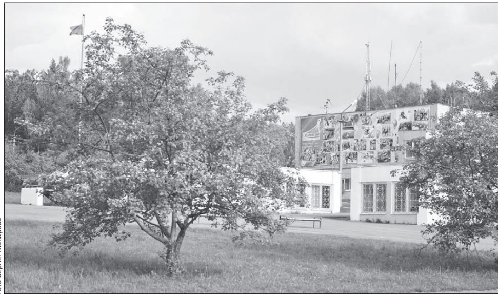
Вторая смена в лагере ФОК «Гагаринский» стартует 26 июня. Она будет посвящена мотивации к изучению русского и английского языков

Три недели пролетели незаметно. В физкультурно-оздоровительном комплексе «Гагаринский» подходит к концу первая смена детского летнего лагеря. Уже в эту субботу ребята вернутся домой. За это короткое время успели породниться с «Гагаринским». Кого ни спроси, заявляют как один: я бы остался еще немножко, а потом — еще!