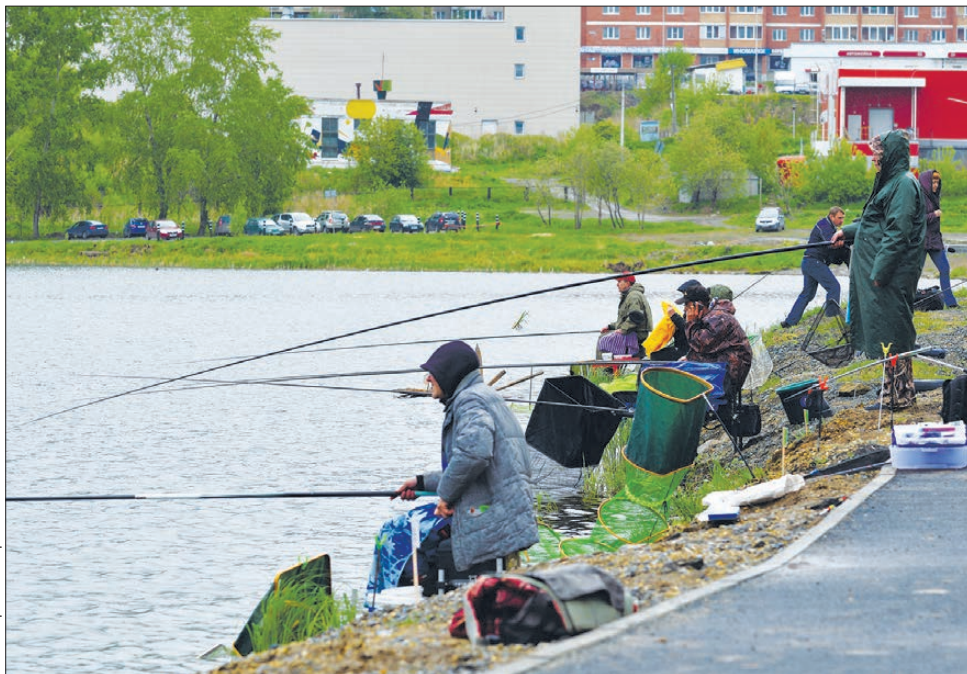
На одном берегу сидели... участники соревнования по ловле рыбы на поплавок «Первоуральский BigfishOne 2018»

– Рыбаки в поисках добычи так же, как и туристы в поисках впечатлений, отправляются в долгий путь, невзирая на