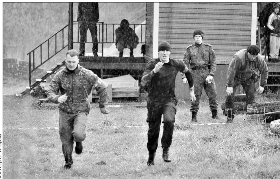
На низком старте. Главное — выдержать! И скорость прохождения этапов победы не гарантирует

И вот прозвучала команда «на старт!». На дистанцию добровольцев отправляли парно. Чем дальше по маршруту, тем меньше оставалось сил — и усложнялись задачи: