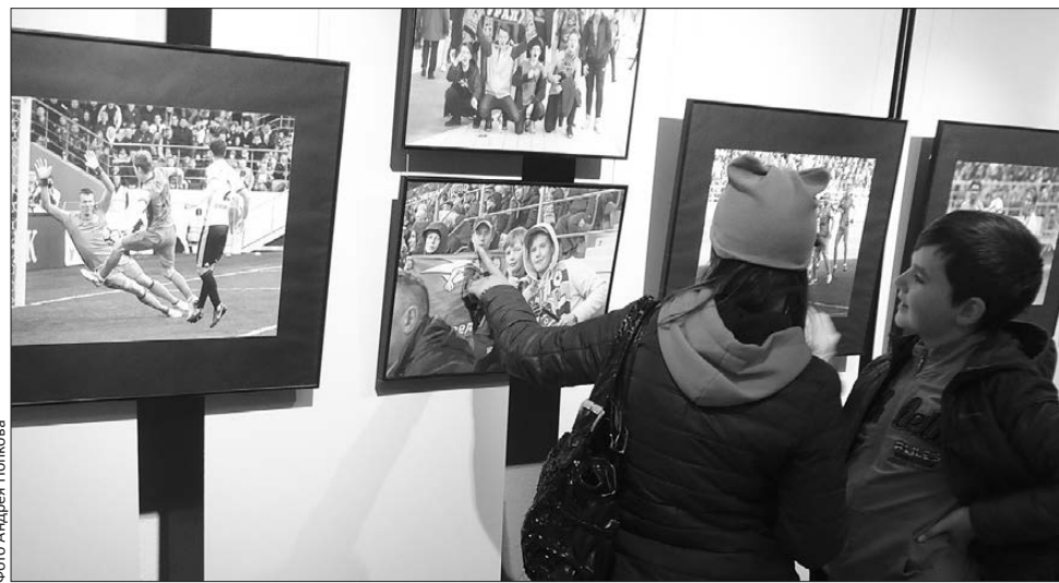
Перипетии футбольных баталий интересны не только мальчишкам, но и слабому полу