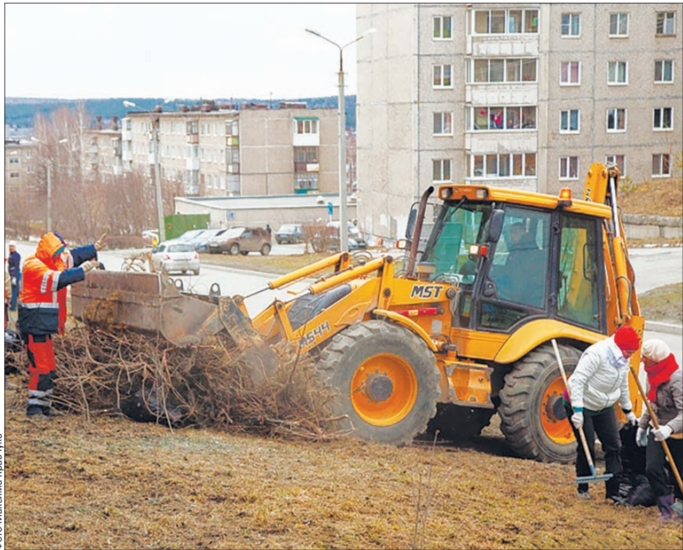
В единстве наша сила: поможем городу стать чистым!

Весна наконец вступила в свои права, а значит, пора браться за генеральную уборку. Всем миром и по общим стандартам благоустройства, которые уже третью кампанию действуют на территории Первоуральска.