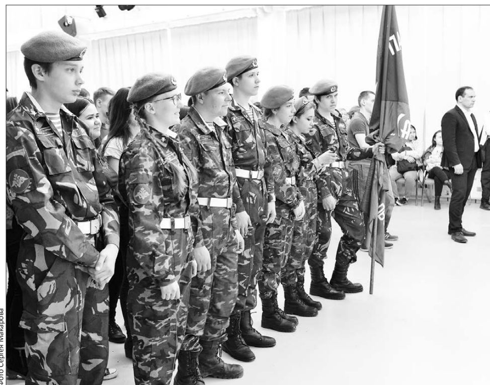
Курсанты парашютно-десантного клуба ЦДТ «Саланг» умеют держать строй