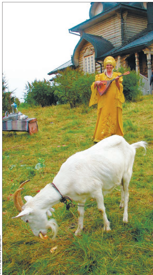
Верхотурье хранит старинные уральские традиции