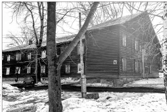
Барак на улице Ильича, 13-а построен более 70 лет назад

В Первоуральске продолжается расселение ветхого и аварийного жилья. На сей раз речь о доме №13-а на улице Ильича в микрорайоне Динас. Большинство его жителей уже подписали с администрацией соглашения на расселение.