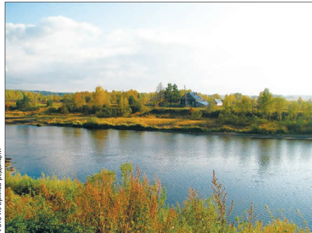
А по Туре — легкий бриз

В часе езды от города раскинулись не менее интерес-