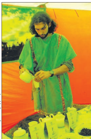
Милости просим на дегустацию

В Верхотурье рады гостям, поэтому не только перекусить, но и полноценно пообедать можно как минимум в четырех местах. В чайной «Монастырский чай» в Свято-Николаевском монастыре, пельменной «Флинстоун» и в двух кафе — «Империя-1» и «Империя-2».