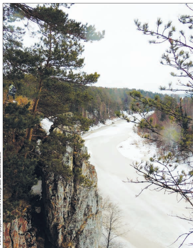
Чусовая красива и в своем зимнем сне