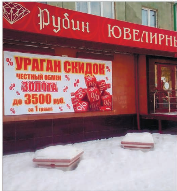
ул. Ватутина, 46

Таких выгодных цен еще не было! Суперскидки на весь ассортимент!