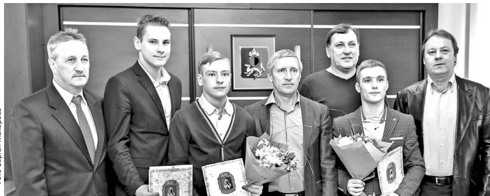
Памятный кадр: ДЮСШ по хоккею с мячом вновь доказали, что они — лучшие

Трое воспитанников ДЮСШ по хоккею с мячом были награждены почетными грамотами главы городского округа Первоуральск, а их наставники — благодарственными письмами. Так высоко были оценены достижения школы на первенстве мира среди юношей.