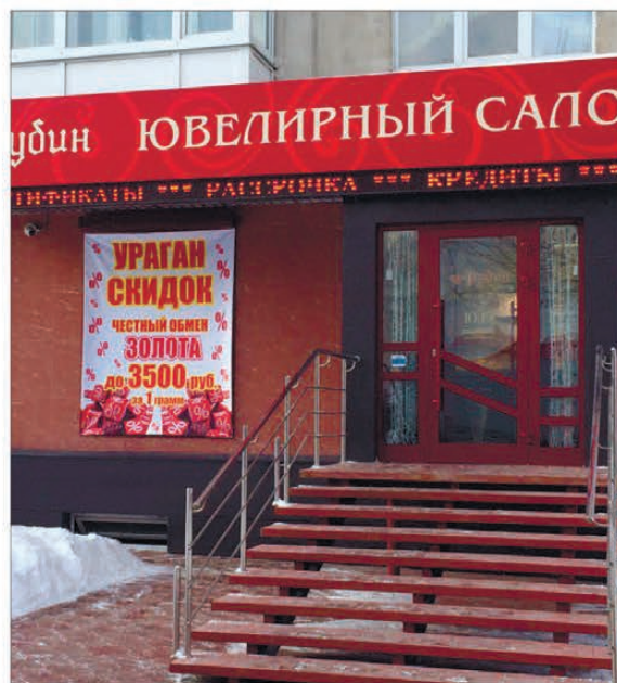
ул. Трубников, 29

Рассрочка от салона и кредит ОТП Банк на выгодных условиях