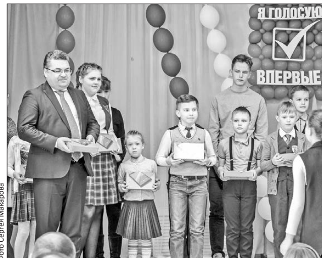
Счастливые обладатели планшетов