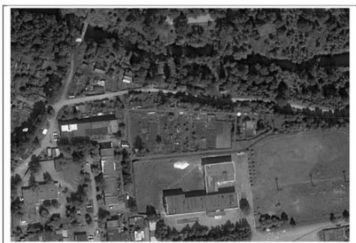
Схема расположения формируемого земельного участка с видом разрешенного использования «коммунальное обслуживание» по адресу: Свердловская область, город Первоуральск, поселок Решеты

Приложение 1 к постановлению Главы городского округа Первоуральск от 09.04.2018 № 28