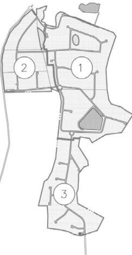
СХЕМА ОЧЕРЕДЕЙ СТРОИТЕЛЬСТВА