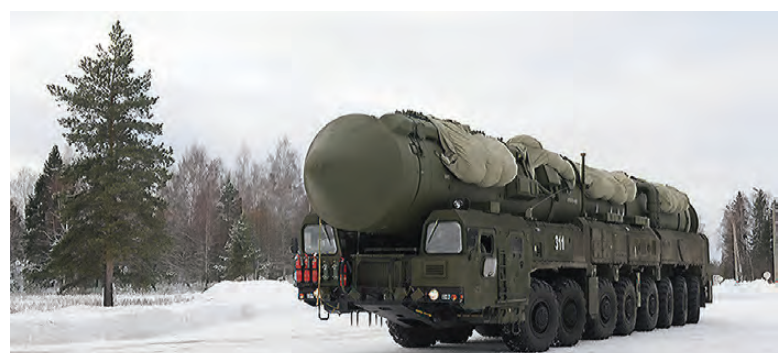
Полк несет службу на современных ПГРК «Ярс».