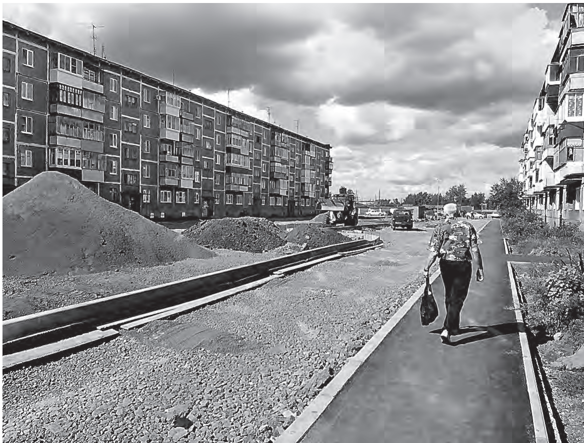
Во дворе на Дарвина уже ходят по новым тротуарам.