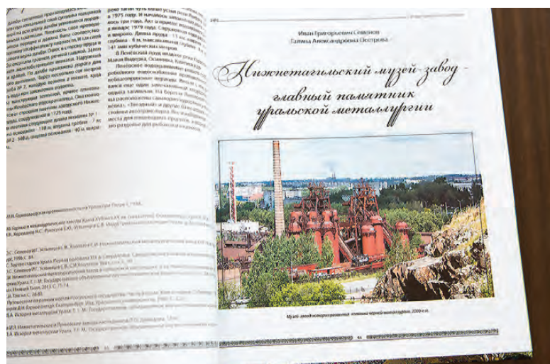
Страницы новой книги о Нижнем Тагиле.

«Хранители исторического наследия», посвященного памятникам истории и культуры Нижнего Тагила. Он подчеркнул, что человек только тогда может считать себя патриотом и граж-