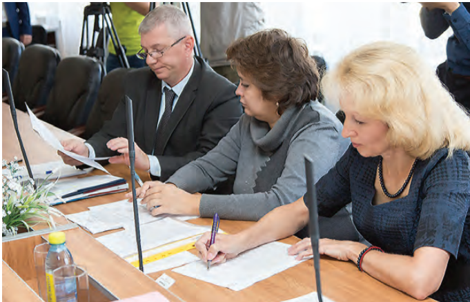
Сотрудники аппарата городской Думы.

становки, создание комфортной городской среды, инвестиционной привлекательности города.