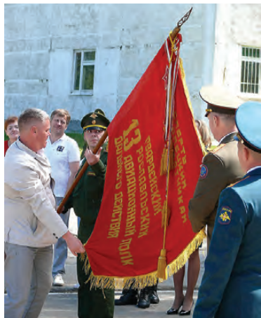
Красное знамя авиаполка – знамя 13-го Гвардейского Рославльского авиационного полка дальнего действия.

20 июня 1959 года произошел переломный момент в истории воинского подразделения: авиационный полк преобразован в 288-й инженерный полк с дислокацией в Конотопе. 5 августа 1959 года полку изменен общевоинской номер на 142-й, который до сих пор закреплен за ним.