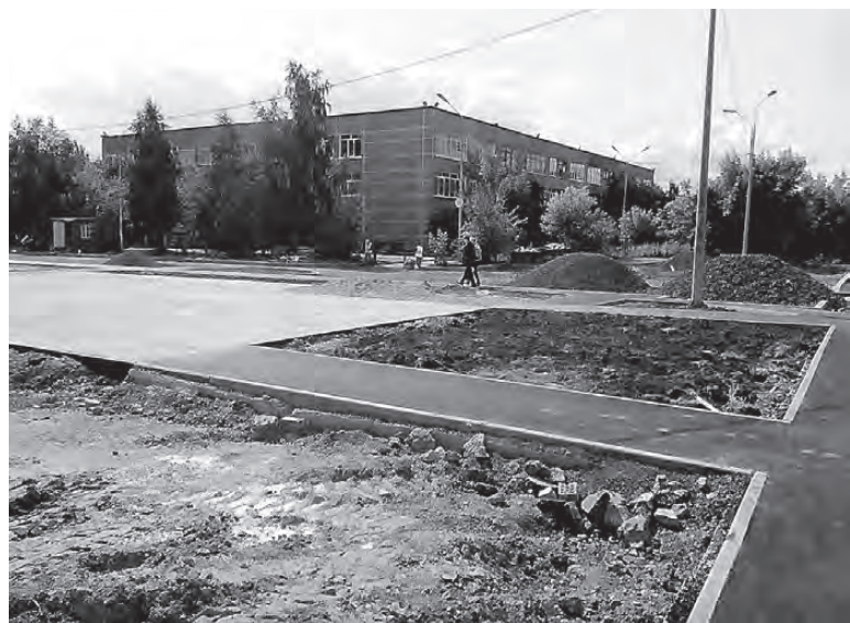
Во дворе на Попова, 19.

и исполнители не учли рельефа квартала и не обеспечили водоотвод. Ливневая вода с улицы Гвардейской, которая раньше уходила в почву, теперь потечет «по асфальту рекой» в обновленный двор.