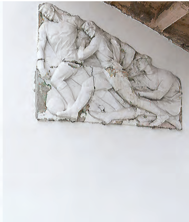
Входная группа на стадион «Юность» будет отремонтирована к сентябрю.