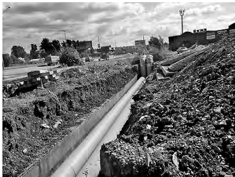
Магистральная трасса НТТС на ЧШ до окончания ремонта.