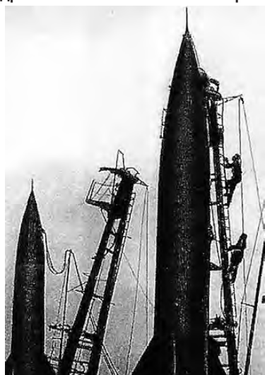
Подготовка ракеты Р-2 (8Ж38) к пуску.

25 сентября 1943 года за особые отличия в боях по освобождению Рославля Смоленской области полку присвоено почетное наименование «Рославльский». Новое полное наименование части – 13-й Гвардейский Рославльский авиационный полк дальнего действия.