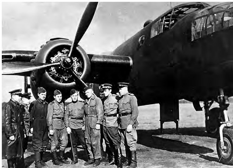
Летчики и механики 13-го Рославльского авиаполка у бомбардировщика В-25.

В 1933 году эскадрилья организационно вошла в состав вновь сформированной 50-й авиационной бригады, сменила место дислокации на аэродром Детское Село. Бригада получает на воору-