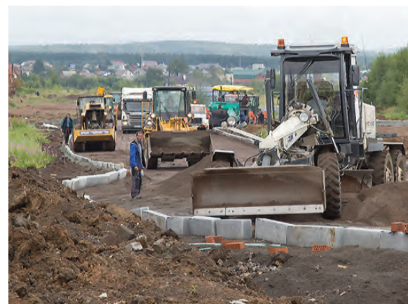
На месте вырубленной из-за строительства дороги рощи посадят новые деревья.