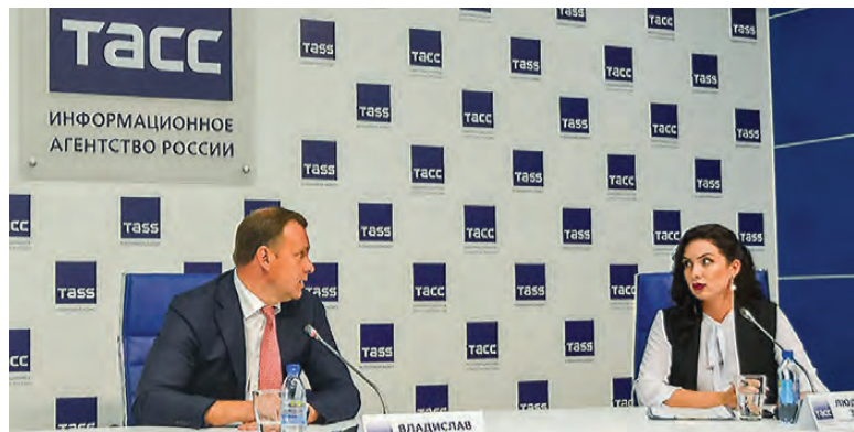
Владислав Пинаев в пресс-центре ТАСС.

Временно исполняющий полномочия главы города Нижний Тагил Владислав Пинаев провел пресс-конференцию в Екатеринбурге. Журналисты затронули широкий спектр тем: от выборов главы города до отмены выставки «Диверсификация».