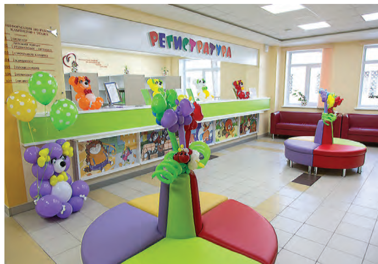
Детский медцентр оформлен как игровая комната.

офтальмотренажера - развивать способность концентрировать взгляд на дальних объектах.