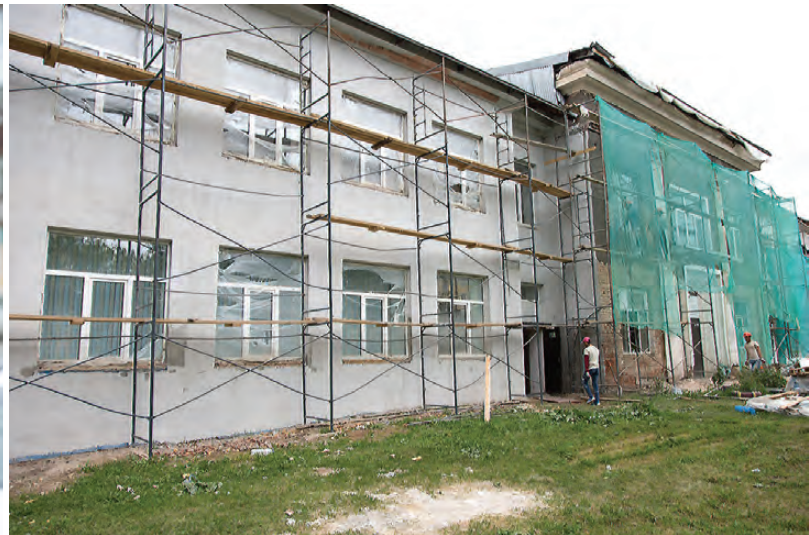
Здание шахматно-шашечного центра скоро снимет строительные леса.