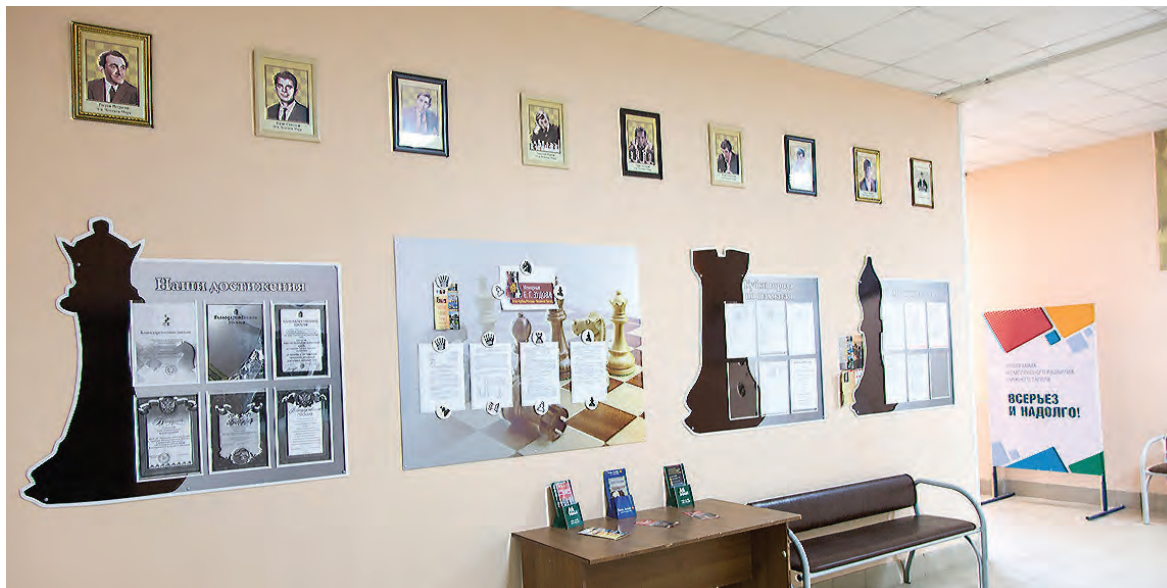
После ремонта ШШЦ не узнать.