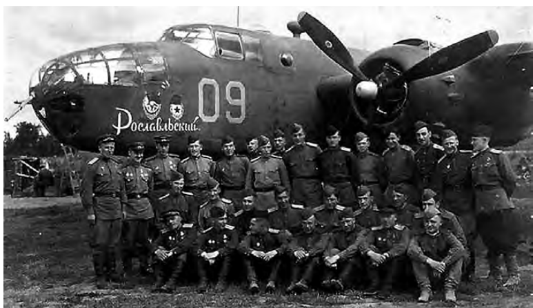
1-я эскадрилья 13-го Гвардейского Краснознаменного Рославльского бомбардировочного полка дальней авиации. Аэродром Умань, 1944 год.