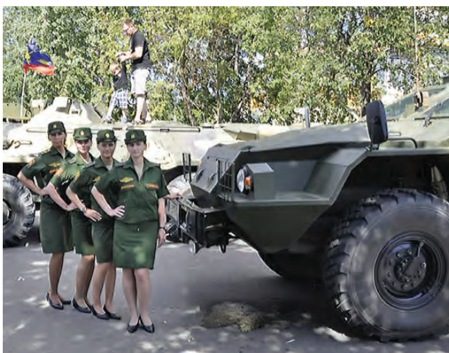
В дивизии служат и девушки.