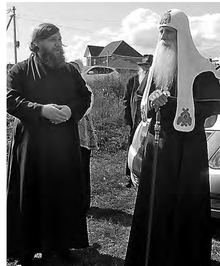
Глава РПСЦ митрополит Корнилий (Титов) на месте строительства храма.

После регистрации община обратилась к городской администрации с просьбой выделить земельный участок под строительство храма. Верующим