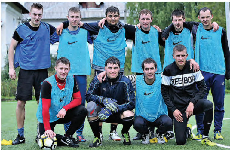
«Смычка» – победитель третьего турнира памяти Степана Мельникова.

В полуфинале «Металлург-НТМК» мог взять реванш у «Распадской», но соперник вновь оказался сильнее. Причем результат получился как под копирку – 4:2 в пользу сибиряков.