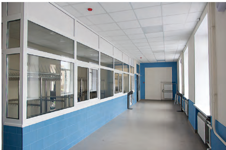
Гардероб и пульт охраны.

вернулась после пединститута уже преподавателем французского языка в 1980 году. Вот и секрет по-домашнему теплого ремонта.