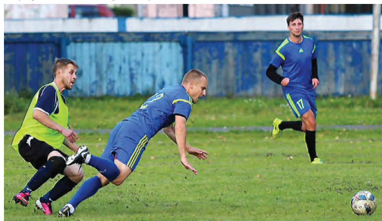
Стадион «Алмаз». На поле футболисты ФК «Гальянский» и нижнетагильского «Металлурга».

А вот хозяевам поля тагильские футболисты «долг» вернули, победив их в матче за третье место – 2:0. Кубок завоевала команда «ЕВРАЗ Сибирь».