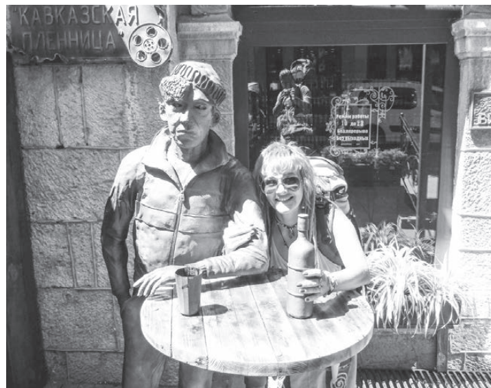
"Выпить" с Никулиным

После прогулки по набережной, изобилующей людьми в плавательных костюмах с надувными матрацами, кафе, сувенирными лавками, аттракционами и прочими увеселительными заведениями посчитали необходимым уединиться от городской суеты на природе. «Выпив» на посешок с Юрием Никулиным (эпизод художественного фильма Аркадия Гайдая «Кавказская пленница» снимали в доме, где установлен монумент герою фильма),