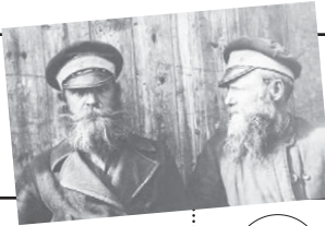
5 сентября 1698 года Петр I установил налог на бороды, чтобы привить своим поданным моду, принятую в других европейских странах