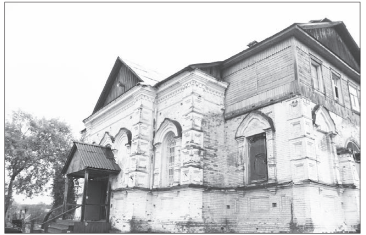
Храм Успения Пресвятой Богородицы в Верхней Сысерти

- Нет, люди к нам идут. В Храм Преображения Господня (маленький бревенчатый Храм рядом – ред.) приходят в праздники до 100 человек. Есть колокольный звон. Когда мы начнем