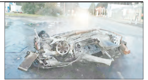
До аварии в машине находились трое мужчин.

преступных деяниях, так как избитый свидетель боялся рассказывать о том, кто совершил преступление. Душегуб и поджигатель пояснил в суде, что к погибшему у него возникла неприязнь. Поскольку осужденный считал потерпевшего причастным к гибели собаки его тёщи. Сельчанина приговорили к лишению свободы на срок 11 лет 6 месяцев с отбыванием в исправительной колонии особого режима.