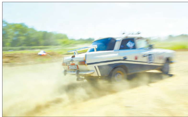
Автомобили на вираже накрывали зрителей плотным облаком пыли.