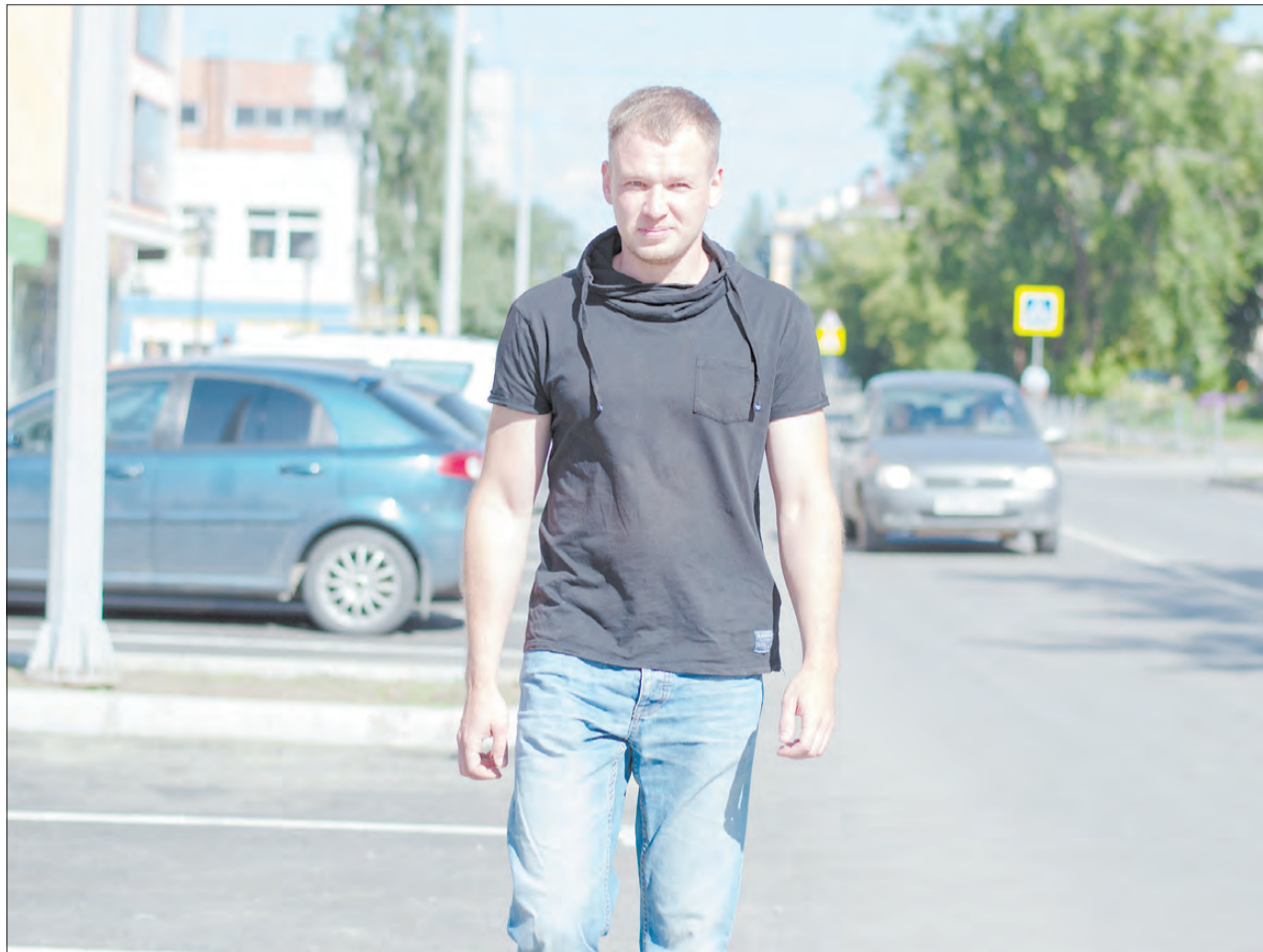
Энергомонтажная компания «СпецЭлектроПрофи» делала освещение на улице Красных Героев после её капитального ремонта.

– Я выдвигался от третьего округа, на нем и работаю. Он не самый проблемный. В поселках гораздо тяжелее. У нас приходят бабушки, просят скамейки поставить. Иногда приходят просто поговорить с депутатом. Бывает, приходят, и просят нас ответить за непопулярные решения Государственной Думы, тогда начинаешь объяснять людям, что мы хотим и депутаты, но решаем совершенно разные задачи. Что есть разные уровни власти и разные уровни компетенций. Что очень многие вопросы, касающиеся областного или федерального законодательства, не в силах решить даже глава города, просто потому, что это не входит в муниципальные