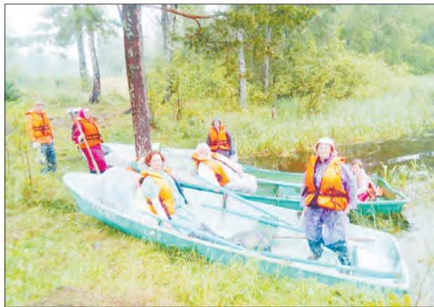
Поход по Ладужским шхерам, июль 2018 года