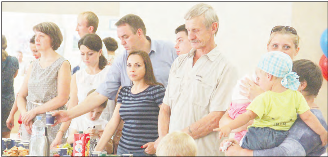
Симво- лические ключи гражданам вручили во дворце культуры «Современ- ник». / 3