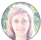
АВТОР ВЕРА БАТАКОВА

Проблема. Как проститься с четвероногим другом и не нарушить закон?