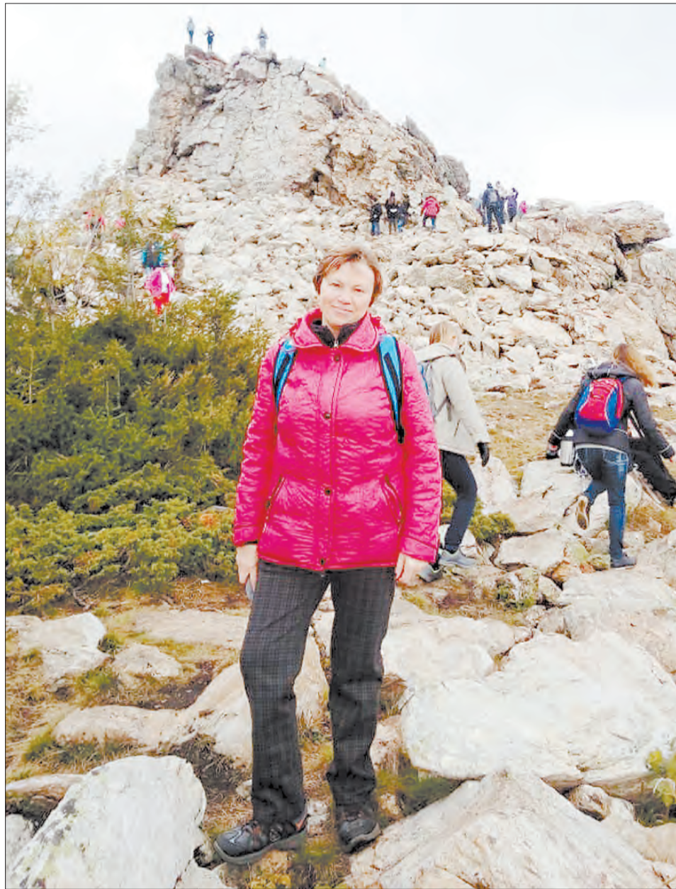
Поездка на хребет Зюраткуль.