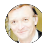
АВТОР НИКОЛАЙ КОРОЛЕВ