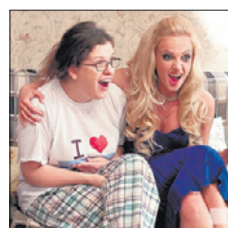
ТНТ • 20.00 «Деффчонки» (16+)