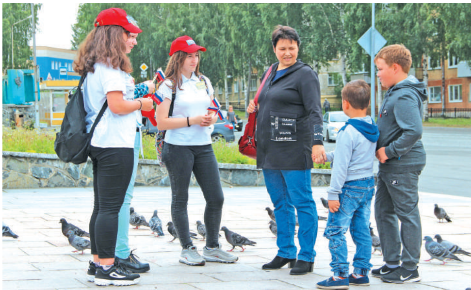
В День российского флага активисты «БумМИРранга» раздали случайным прохожим 150 флажков, 20 бантиков, 100 буклетов, а также провели опросы и беседы.

День Государственного флага Российской Федерации не является выходным днём в нашей стране, но уже традиционно к этому важному празднику приурочено множество мероприятий – торжественные шествия, пропагандистские акции, молодёжные флешмобы, авто-, мотопробеги. Их главная цель – рассказать жителям историю праздника, важность и значение государственных символов России.