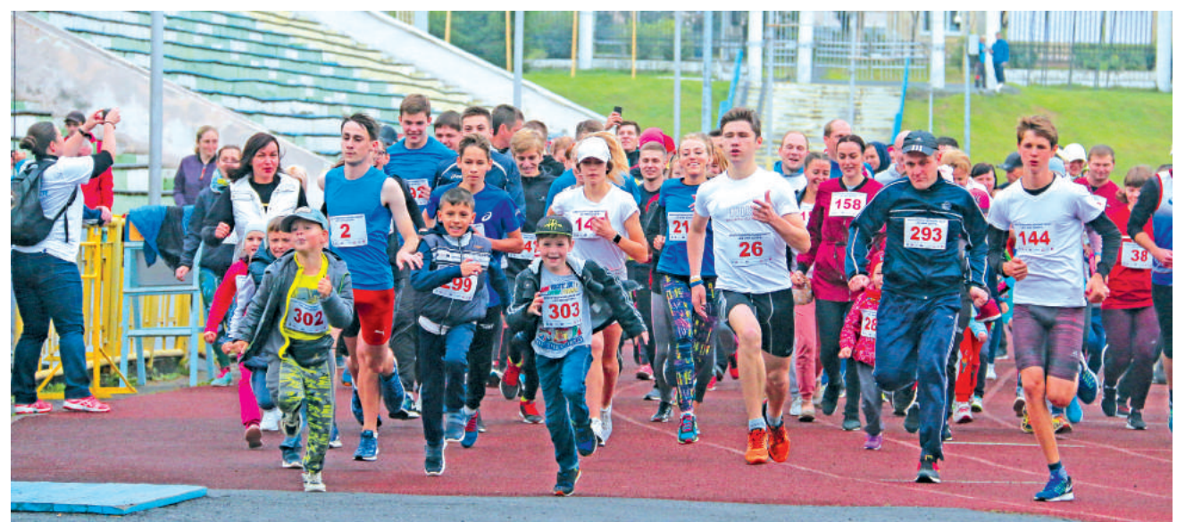
Благотворительную акцию завершил массовый забег. На дистанцию в 1300 метров вышли взрослые, дети, руководители города, дирекция комбината.

Отметим, что акция продолжается! Банковские реквизиты для перевода денежных средств были опубликованы в газете «Вестник» № 34 от 23 августа.