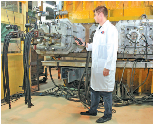
Специалист комбината «Электрохимприбор» выполняет проверку первого контура установки Е-7.

31 августа в цехе по производству изотопов (001) в полном объёме начнёт свою работу Е-7.