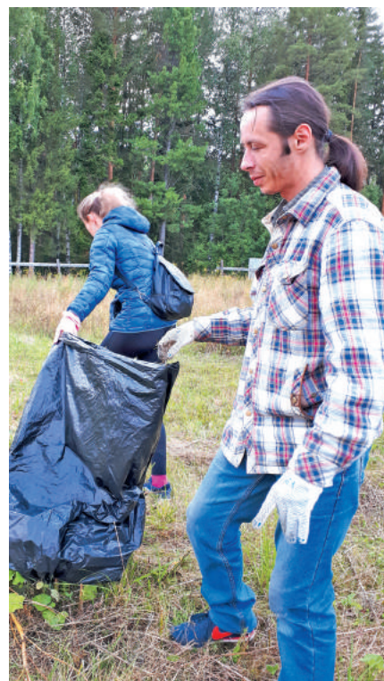
Вокруг детской площадки за детской поликлиникой волонтеры «молодёжки» собрали 25 мешков мусора.

– Хочу сказать слова благодарности организаторам этой чудесной акции – отделу по физической культуре, спорту, молодёж-