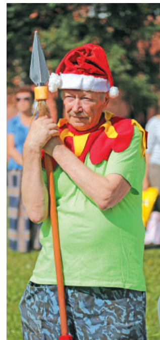
«За Русь Святую!»

Отметим, что мероприятие проходило в рамках месячника пенсионера и было посвящено Дню пожилого человека.