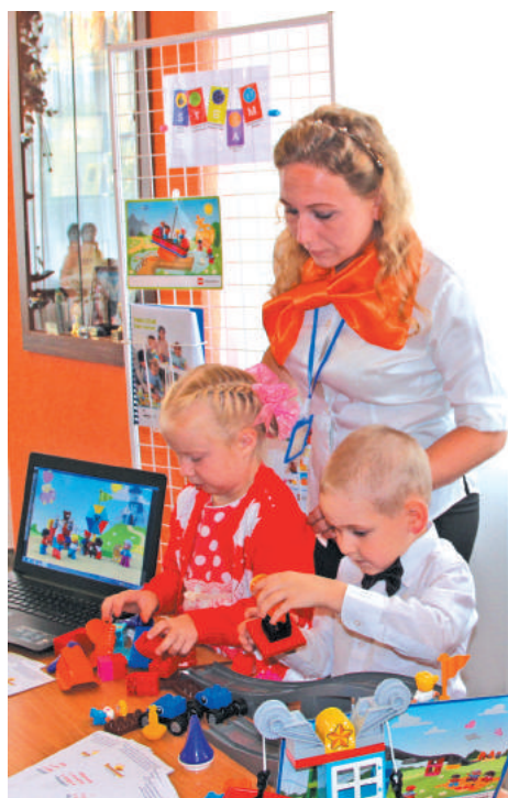
Профориентация сегодня начинается уже на этапе дошкольного образования. В выставке, предшествующей основной части форума, коллективы образовательных учреждений делились педагогическими новациями данной направленности.

Участниками форума отмечено, что профориентационная работа сегодня – на новом этапе развития. По ежегодному опросу старшеклассников, в списке десяти популярных профессий – медицинские, инженерные специальности, силовые структуры. Более 80% старшеклассников ответили, что не хотели бы иметь профессию, как у родителей, а стремятся найти собственный путь профессионального самоопределения. В определении жизненных планов для современной молодежи более значимы самообразование, медиаресурсы, дополнительное образование.