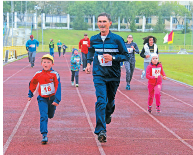
Участники акции бежали с удовольствием, с азартом, несмотря на непогоду...

В этот раз благотворительный забег проходил под лозунгом «Подари улыбку детям из детских домов».