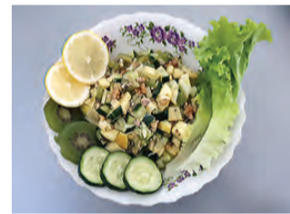
Подготовила Людмила ПОГОДИНА.

Огурец, киви и авокадо вымыть, очистить от кожуры и нарезать. Яблоко очистить от семян и тоже нарезать. 2 ст. ложки кедровых или грецких орехов измельчить, добавить сок лимона и оливковое масло, перемешать. Влить смесь в салат и осторожно перемешать.