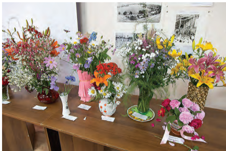
Экспонаты конкурса букетов.

кладное творчество, зрительницы зашептались: «Не может быть!» Мастерница пояснила, что фоамиран – декоративный пенный материал, его еще называют вспененной резиной, это новый материал в современном рукоделии, и с ним ин-