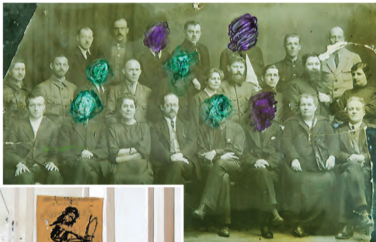
«Исчезнувшие». Людей вычеркивали из жизни, из истории, с фотографий...

Этот проект Берлинского дома литературы представил музей истории ГУЛАГа. В экспозиции – серия живописных портретов Варлама Шаламова, созданная художником Николаем Наседкиным, фотогра-