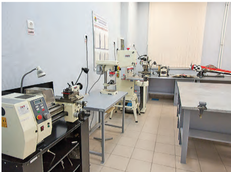
Центр оснащен оборудованием, позволяющим проводить физические опыты и создавать радиоэлектронные схемы.