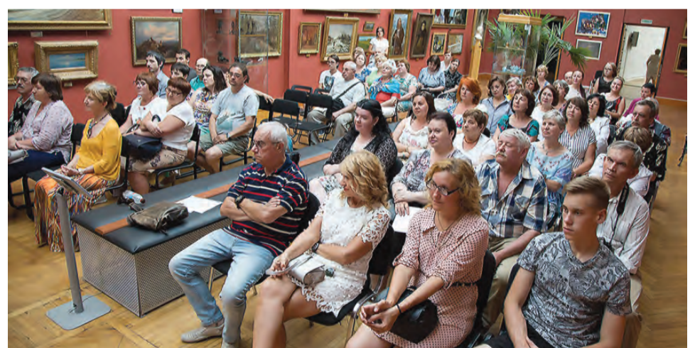
Тагильчане в Русском зале.

сказ о творчестве великого поэта, которого многие знают только как автора песен и актера. Его стихи не так широко известны, а с прозой большинство и вовсе не знакомо.