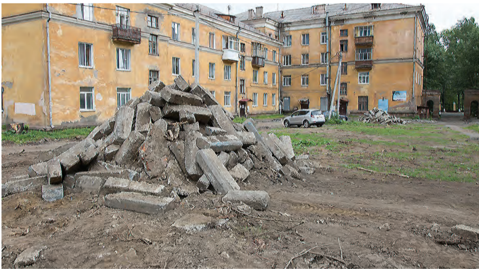
Такой пейзаж успел надоесть жителям двора на пересечении улиц Металлургов, Технической и Кутузова. 31 июля здесь появился экскаватор – начали вывозить демонтированные конструкции.

Ход ремонтов во дворах по программе «Комфортная городская среда» беспокоит многих тагильчан