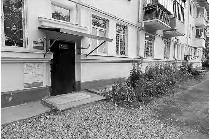
Даже после ливней во дворе теперь можно ходить.