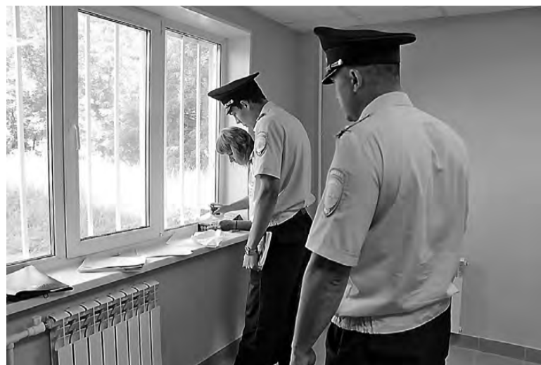
Новые просторные опорные пункты.