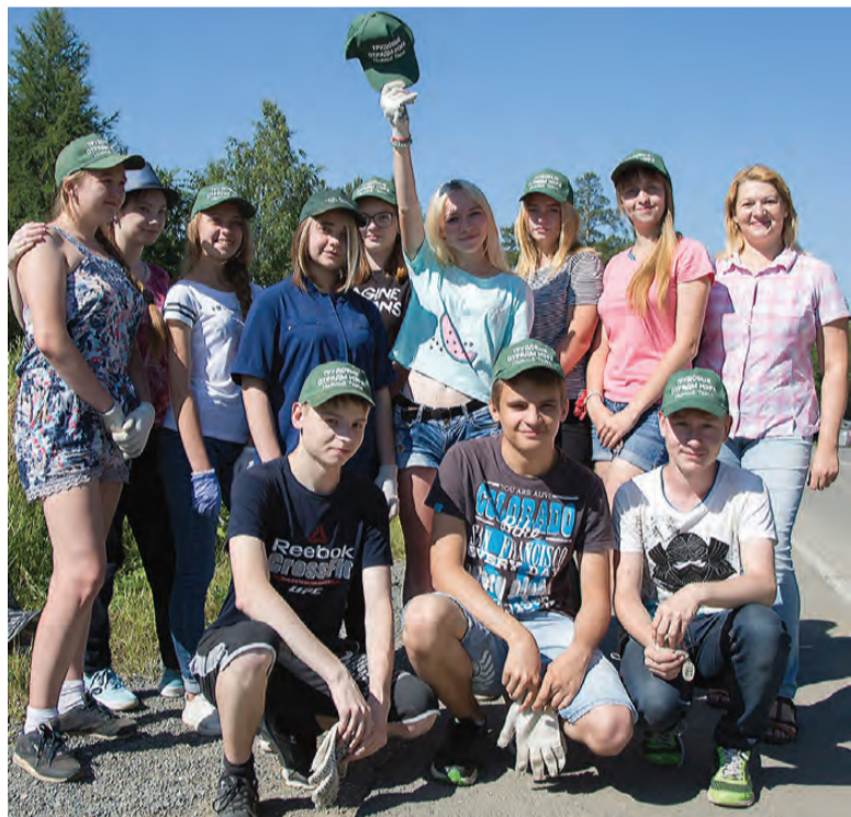
Пять минут – перерыв для фото, и снова за работу.