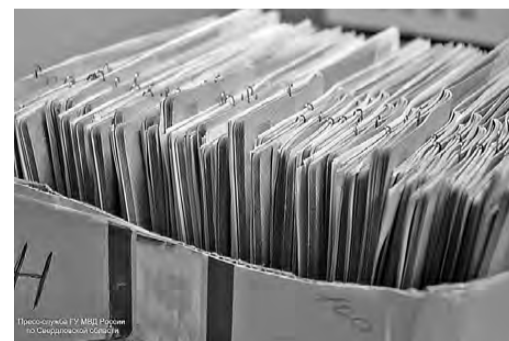
С загранпаспортом не шутят.

Правоохранители предупреждают граждан, что данные действия могут быть квалифицированы по части 3 статьи 327 УК Российской Федерации – использование заведомо подложного документа. Санкция данной статьи предусматривает наказание вплоть до ареста на срок до шести месяцев.