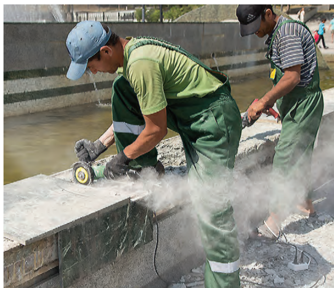
Подрядчику необходимо полностью обновить облик фонтана.