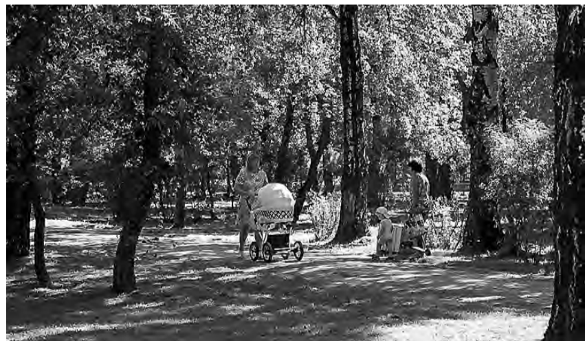
Сквер удобен для прогулок.

Завтра, 3 августа, Дзержинский район отмечает свое 85-летие. И накануне юбилея на улицах Вагонки продолжается работа по благоустройству.