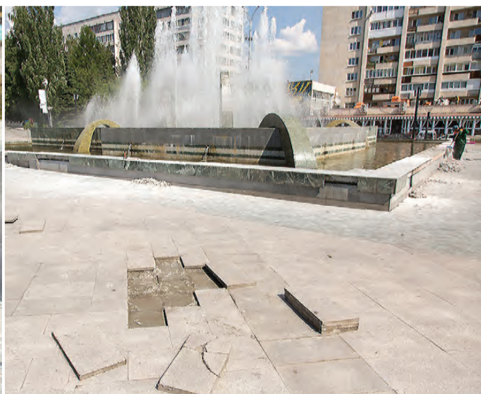
А также заменить сломанные плиты.