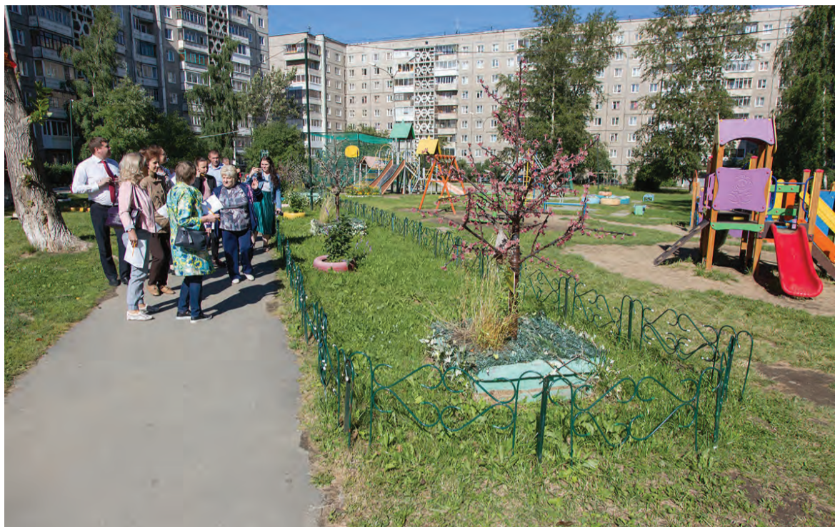
Комиссия, в которую входят 10 человек - представителей администрации и общественных организаций, во дворе на улице Зари, 11.

В понедельник конкурсная комиссия посетила объекты, которые были заявлены районами на конкурс «Лучший двор, дом, подъезд». Осмотрели 12 дворов, 10 домов и 15 подъездов. Примечательно, что подавляющее число конкурсантов приняло участие во всех трех номинациях. Например, жители девятиэтажки №9 на улице Максарева показали и двор, и дом, и целых три подъезда. В итоге отмечены дважды: дом получил третье место, а пятый подъезд - второе. На первое место в обеих номинациях вышел дом №19 на улице Нижней Черепанова с прекрасным оформленным третьим подъездом.