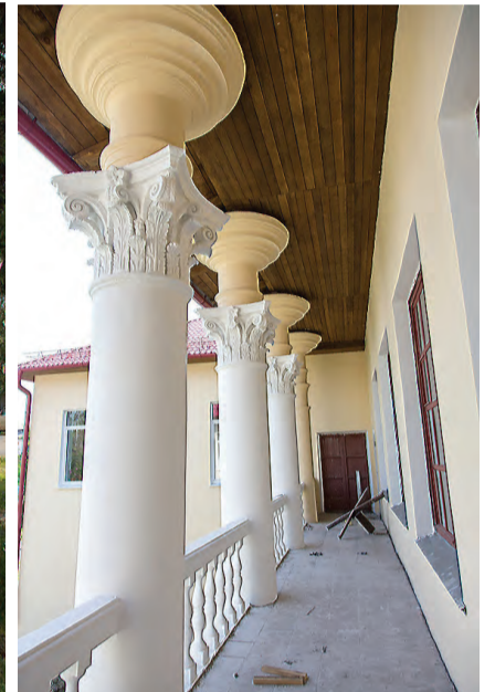
Колоннада балкона на заднем фасаде.