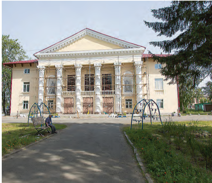
Вид на Дворец национальных культур от сквера. Фасад пока в лесах, но уже сияет новизной.