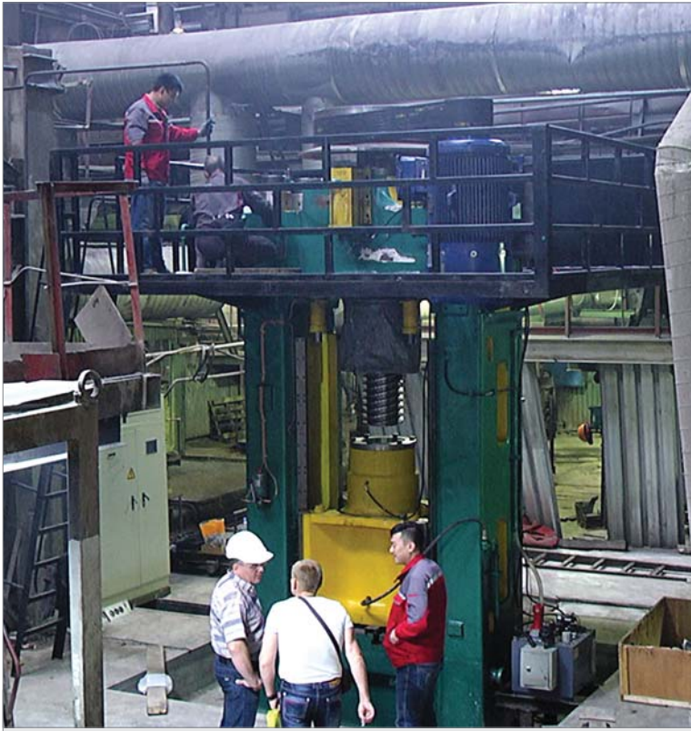
Монтаж оборудования идёт полным ходом.

Подробнее о крупном заводском приобретении — в следующем номере.