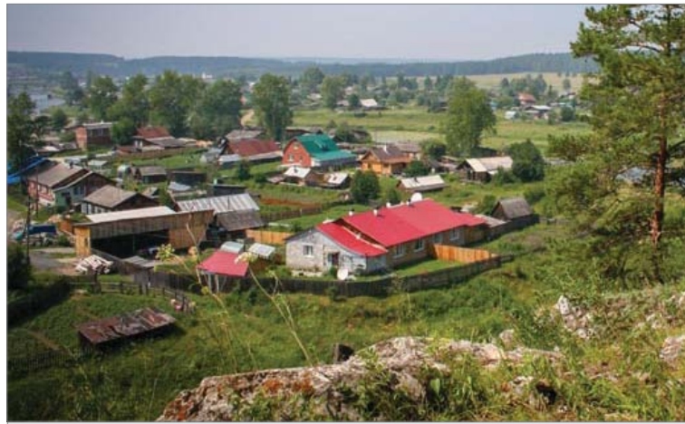
Вид на Коуровку и Прогресс с камня Шишимского.

Таким был век прошлый. Теперь о главе современной. В 2012 году в поселке был создан общественный совет,