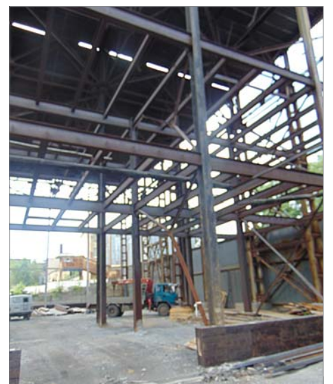
В этом высотном здании разместится линия дробления и отсева.

Следующие шаги — монтаж сэндвич-панелей, оконных проёмов, дверей. С крышей ещё много хлопот. В.Федяков всё это перечислял с оптимизмом, уверенный, что кол-