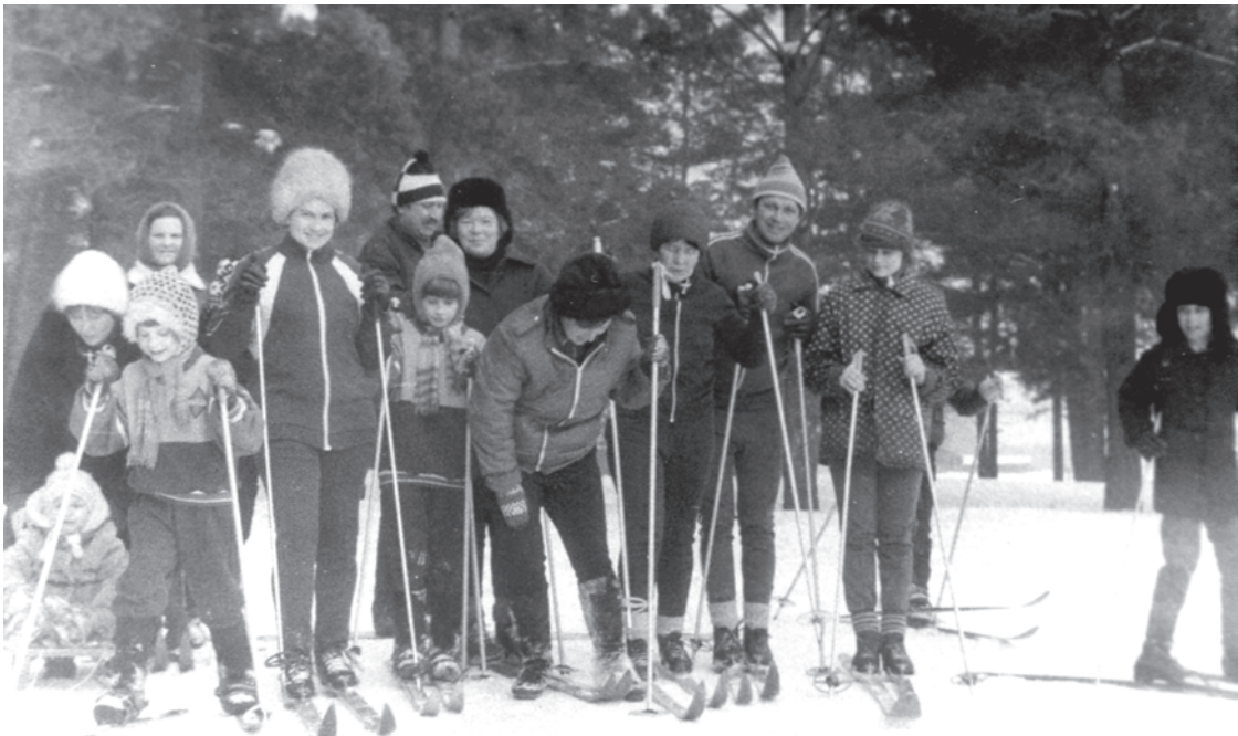
22.02.1987 г. Талицкий молзавод. Прогулка на лыжах.