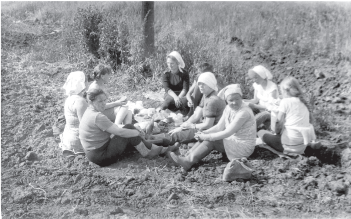
Август 1985 г. Талицкий молзавод. В колхозе на прополке свеклы.