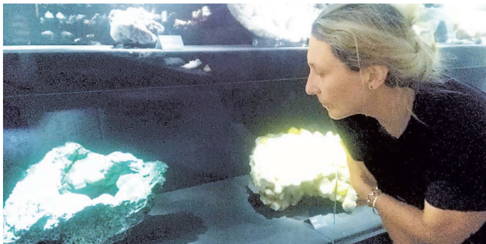
Посетителей музея во Флоренции удивляют размеры уральского камня, но в Нижнем Тагиле и в Екатеринбурге выставлены гораздо более впечатляющие экземпляры.

Надо заметить, что подарки Анатолий Демидов, имея двухмиллионный годовой доход, делал царские. Так, Папе Пию IX он преподнес полутораметровый малахитовый крест, который сейчас находится в библиотеке Ватикана, директору Венского музея естественного знания Морису Херсту — самородок платины разме-