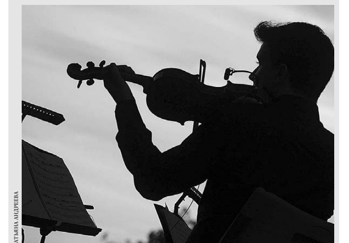
Девятый Венский фестиваль открылся большим концертом — первым выступлением в России ансамбля классической музыки Obertron String Octet из австрийского Граца.

Среди хитов праздника искусств — концерт «Хаваша симфоник-арена шоу», знаменитого музыкального обозрения, в котором участвуют 150 исполнителей от Армении до Индии. На огромном экране зрители увидят записи опер «Милосердие Тита» Моцарта (по трансляции из Зальцбурга, за пультом Теодор Курентзис), «Ромео и Джульетта» Гуно с Хуаном Диего Флоресом и Аидой Гарифуллиной (за пультом Венской оперы Пласидо Доминго), «Аида» Верди с Анной Нетребко (трансляция из Зальцбурга, дирижер Риккардо Мути).