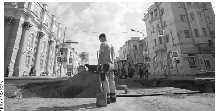
Ремонт сетей на улицах Кургана продолжится до середины октября.