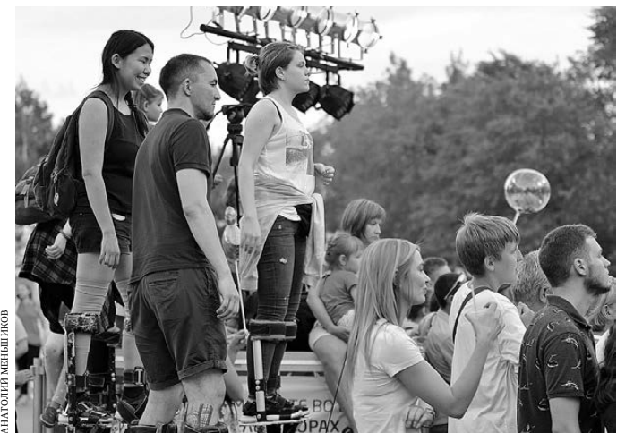
Зрители, пришедшие на представление на ходулях, с комфортом наблюдали за происходящим на сцене.