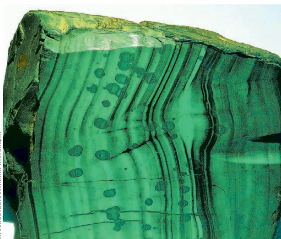
Фото малахита (каталожный номер 135286), преодолевшего 5000 км из Нижнетагильска во Флоренцию, публикуется с любезного разрешения Музея естествознания Флоренции.