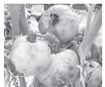
Фитофтора на томатах