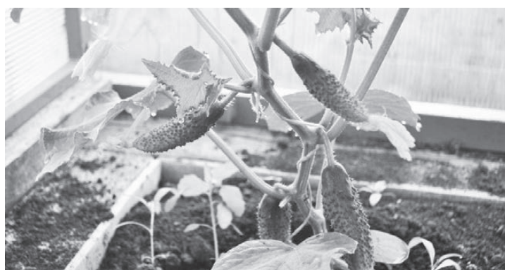
Огурцы, которые в этом году приотстали в развитии, нужно собирать не реже чем раз в 2-3 дня, это увеличит урожайность

Август - пора появления фитофторы на томатах, чтоб избежать этой напасти, регулярно проветривайте теплицы, удаляйте нижние листья, не давайте листьям контактировать с землей, кисти томатов должны быть сухими, поэтому поливайте с осторожностью, и только под корешок, после по-