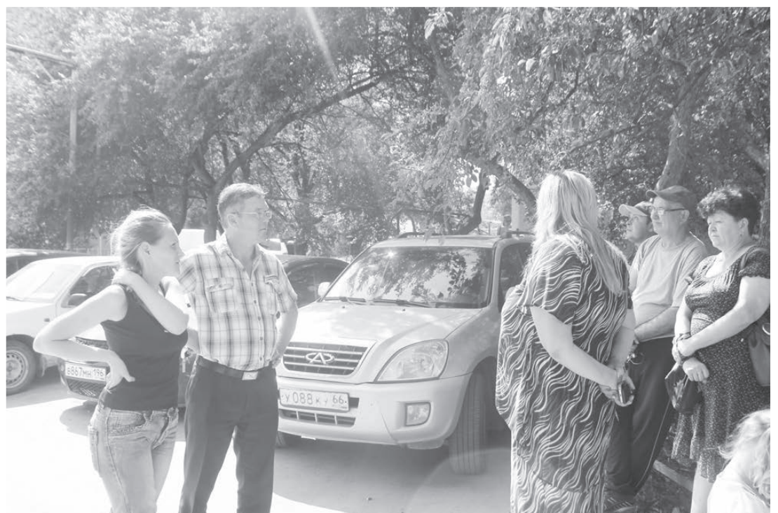
Представители «Ростелекома» приехали объясниться с жителями

В итоге прокуратура отнесет иск в суд уже на этой неделе. Истец будет требовать расторжения договора между сотовой ком-