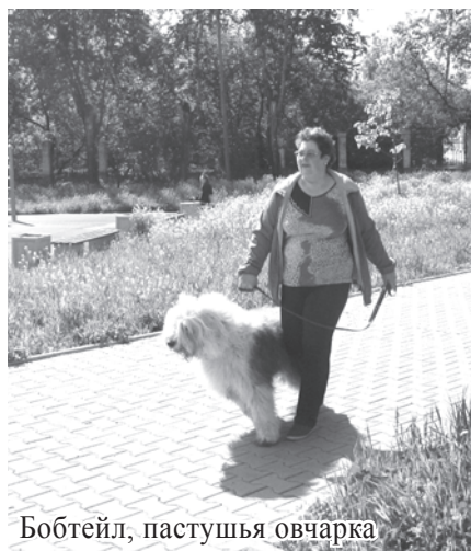
Бобтейл, пастушья овчарка