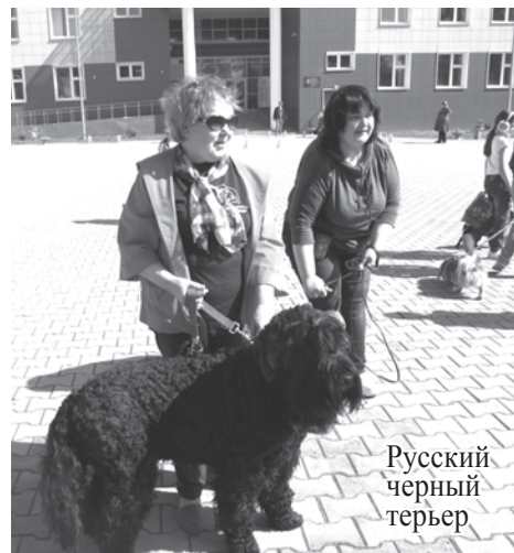
Русский черный терьер