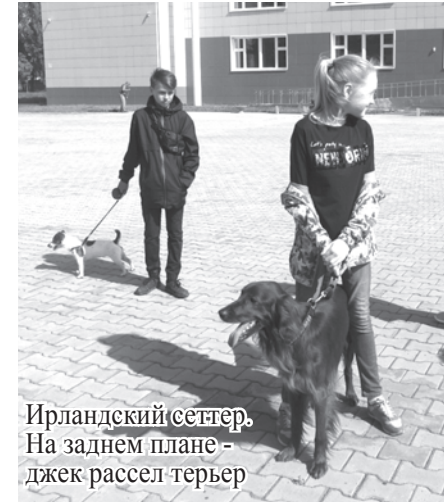
Ирландский сеттер. На заднем плане - джек-рассел-терьер