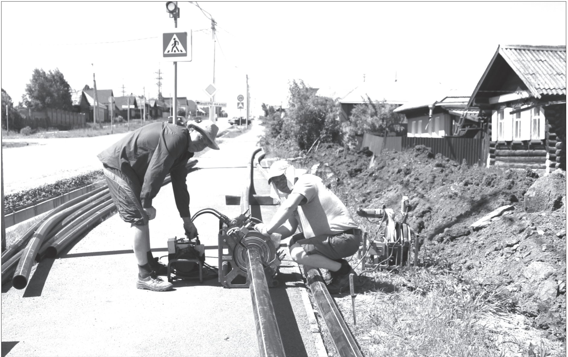
Прокладка газопровода на улице Фрунзе, Нижняя Салда

КАЖДОЕ ВОСКРЕСЕНЬЕ Общество «Трезвость и здоровье» На протяжении 30 лет проводит: Лекции, беседы, консультации КОДИРОВАНИЕ по методу Довженко Алкогольная зависимость в 12-00, Избыточный вес в 9-00 Тел.: 8(3435)33-11-62, сот.: 8-922-200-55-64 г. Н.Тагил, ул. Уральская 9 (Центр) Наш сайт: fotos-tagil@yandex.ru