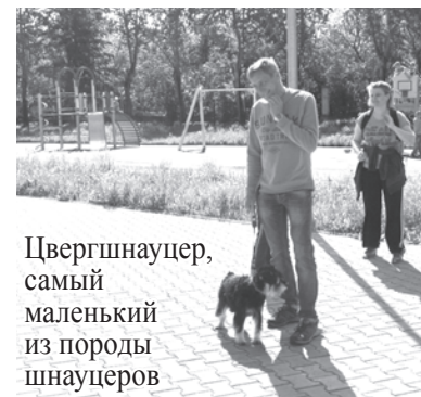
Цвергшнауцер, самый маленький из породы шнауцеров