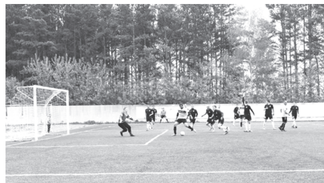
Фрагмент матча "Титана" в Реже

Следующий свой матч «титановцы» вновь сыграют на выезде в Богдановиче против местного «Факела». Домашний матч пройдёт на стадионе «Старт» 7 июля,