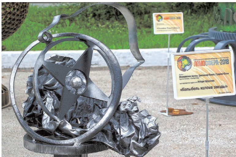
Арт-объект «Колыбель излома звезды», по словам его создателей, молодых сотрудников Группы Синара, — это символ сердца, несмотря ни на что стремящегося к любви.

шихты до трубы. С переработкой металлолома он сталкивается ежедневно, вот и изобразил то, что ему знакомо и понятно.