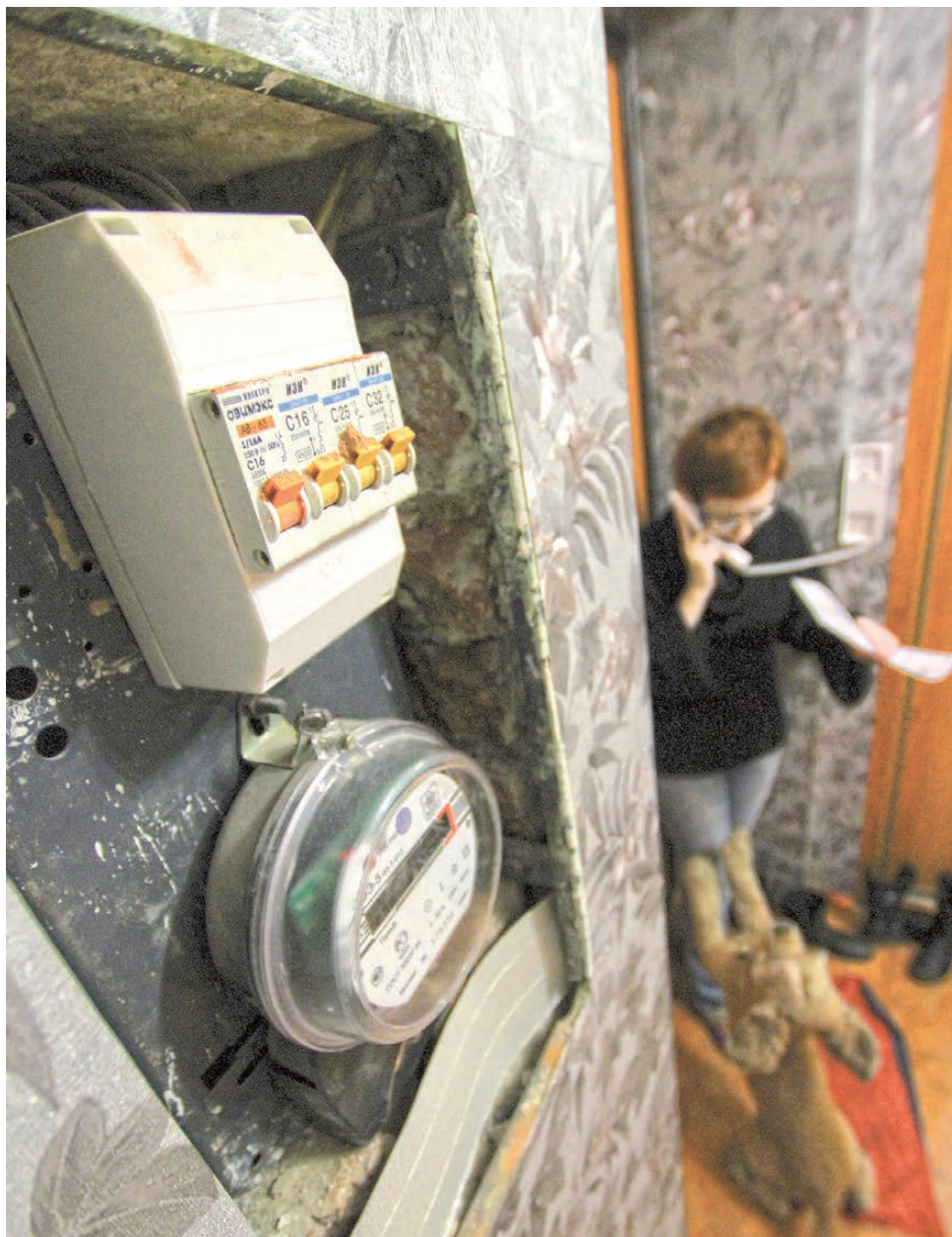
Поначалу показалось, что недоразумение удастся уладить одним телефонным звонком.

Мать с сыном снова пошли по кругу. Оказалось, что на этот раз деньги сняли по заявлению энергосбытовой компании за неоплаченное электричество. Они возразили. Суд