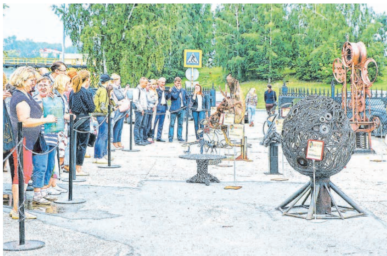
Выставка скульптур «Ломосфера-2018» расположилась на открытой площадке музея «Северская домна». Экспозицию можно посетить до 18 августа 2018 года.

В Полевском провели конкурс скульптур из металлолома