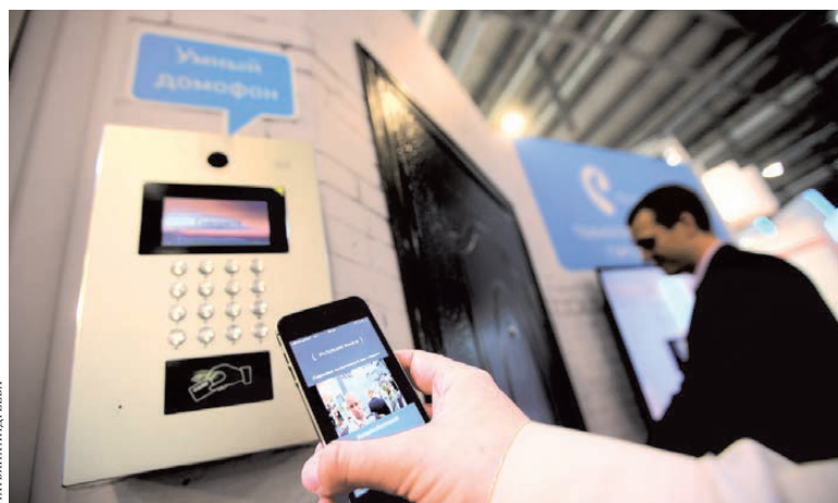
Умный домофон защитит квартиру от непрошенных гостей.