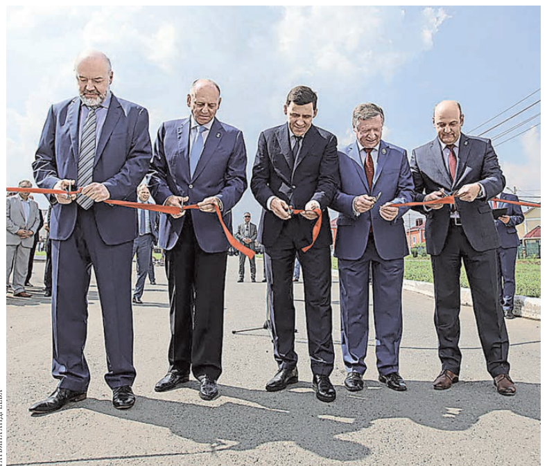
Глава региона принял участие в открытии транспортной развязки и бульвара.

возможности возвести в районе современную общеобразовательную школу.