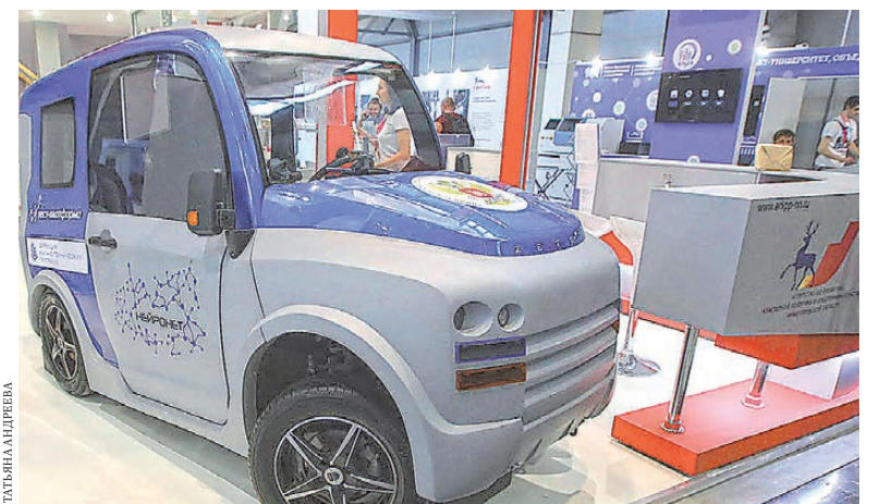
Чтобы управлять этой простенькой, на первый взгляд, машиной, придется напрячь извилины.

Чтобы машина понимала водителя, он должен надеть специальный головной убор с датчиками, считывающими команду мозга. По задумке разработчиков, чудо-автомобиль будет востребован людьми, у которых ограничены двигательные