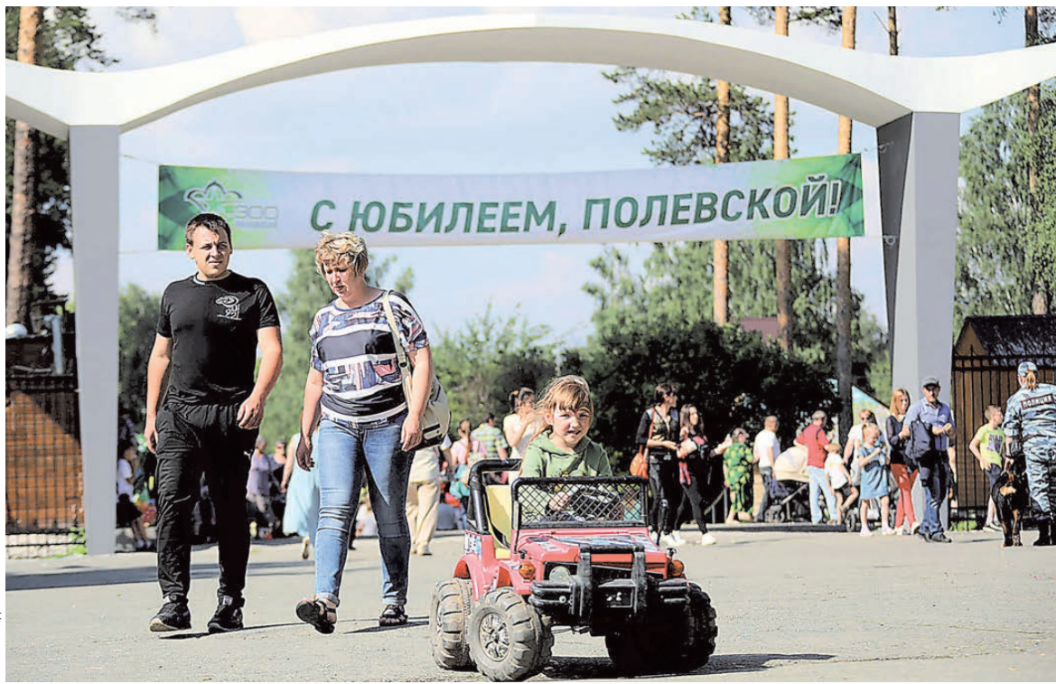
Традиционно в День города отмечается профессиональный праздник металлургов.

— За последние десять лет в Полевском построено около 80 тысяч квадратных метров жилья, а всего с начала работы ТМК в городе — 100 тысяч. Это не только многоэтажные дома, но и таунхаусы, коттеджи. В 2019 году будут сданы в эксплуатацию еще 126 домов — 72 коттеджа и 54 таунхауса. Мы поговорили с главой региона и о социальной инфраструктуре —