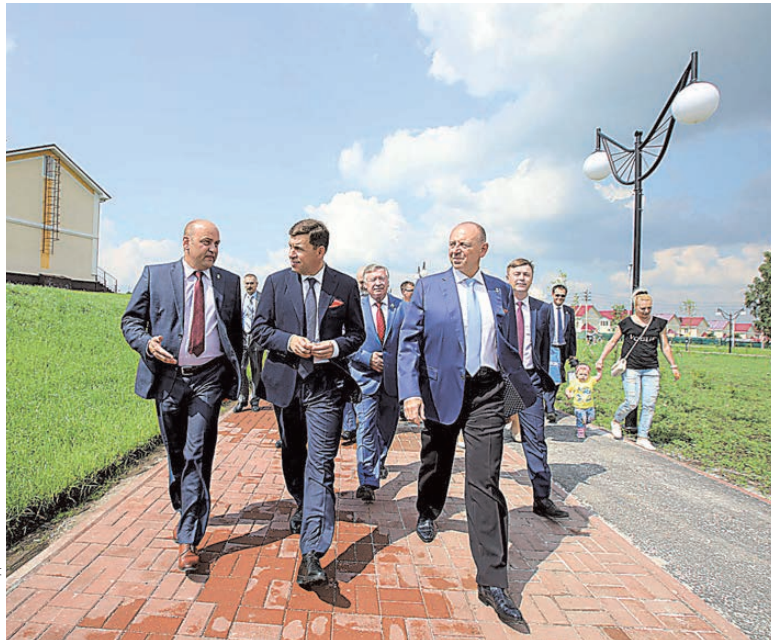
ТМК выделила 75 миллионов рублей для благоустройства нового микрорайона Полевского.

Горожане сами выбрали эту территорию для благоустройства через открытое голосование и уже успели оценить новые объекты инфраструктуры. Например, специально выделенную велодорожку ежедневно обкатывают десятки велосипедистов и скейтбордистов. Они громче всех аплодировали, когда перерезали красную ленточку. Теперь развязка и кольцевой бульвар официально открыты.