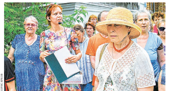
Желающих прогуляться по Екатеринбургу набралось 60 человек.