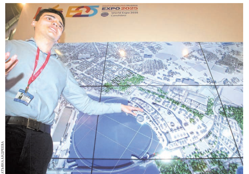
Огромный Экспо-парк «напичкают» технологиями, о которых пишут фантасты.