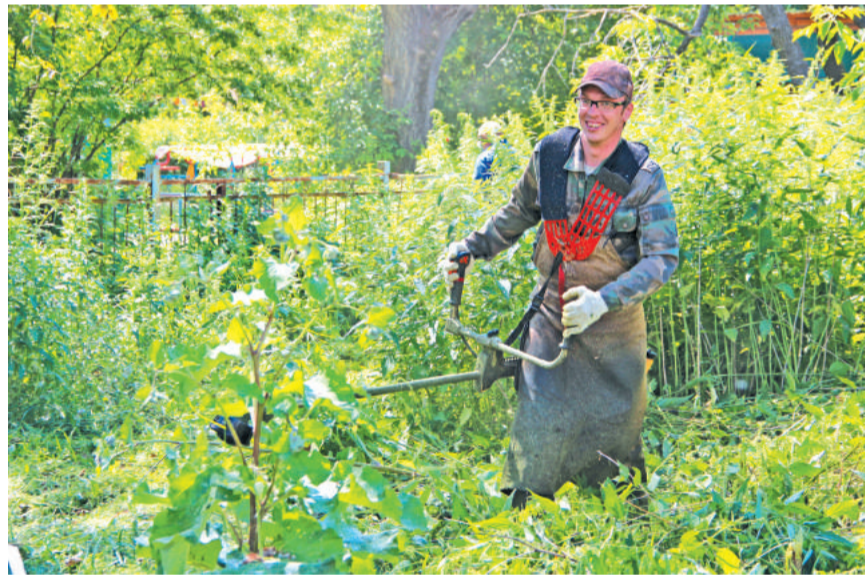
Жужжание газонокосилок и триммеров слышно во дворах Лесного.

На сегодняшний день полностью выкошена территория шестого, четвёртого ЖЭКа, посёлка Таёжный. Подходит к завершению работа на участках пятого ЖЭКа – на улицах Ленина и Юбилейная. Сегодня бригада вышла на гостевой маршрут по улице Ленина и на других участках.