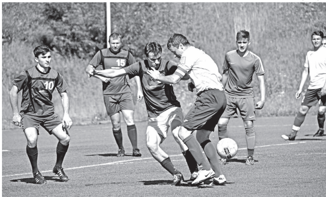
На выезде в Краснотурьинске. Борьбу ведёт капитан «Старта».