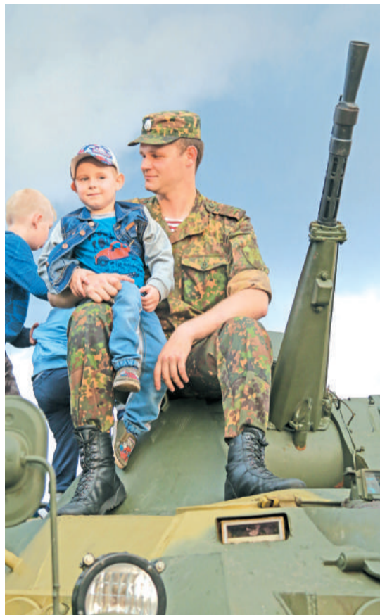
Наше будущее – в надёжных руках.

Завершилась поверка парадным маршем, после чего военнослужащие вместе с семьями, а также гости мероприятия посетили выставку военной техники, концерт ансамбля песни и пляски Уральского округа войск национальной гвардии Российской Федерации и не упустили шанс отведать солдатской каши.