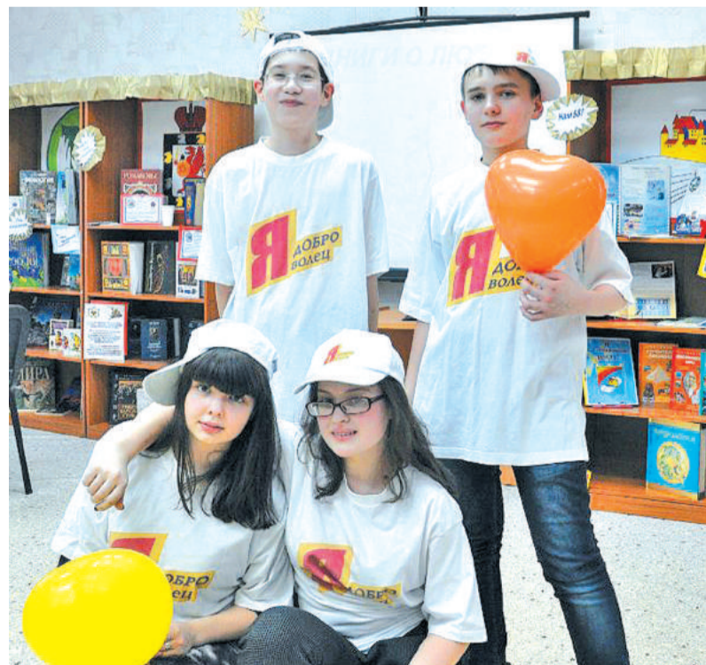
Штаб существует в «Гайдаровке» уже 9 лет. На фото – инициативная группа ДОБРОвольцев 2013 года.