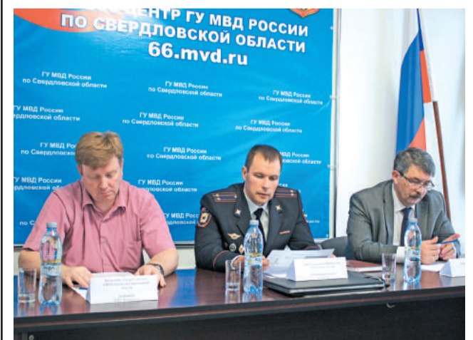
Участники совещания по подведению итогов оперативно-служебной деятельности.