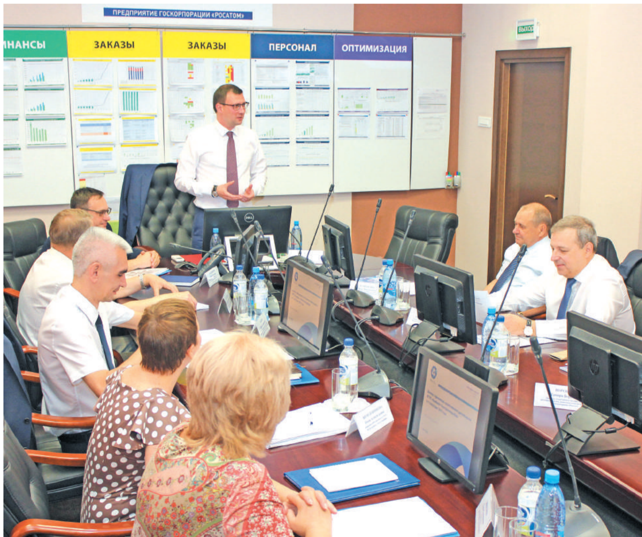
Во время совещания.

Пресс-служба комбината «Электрохимприбор». ФОТО ДМИТРИЯ КОМАРОВА.