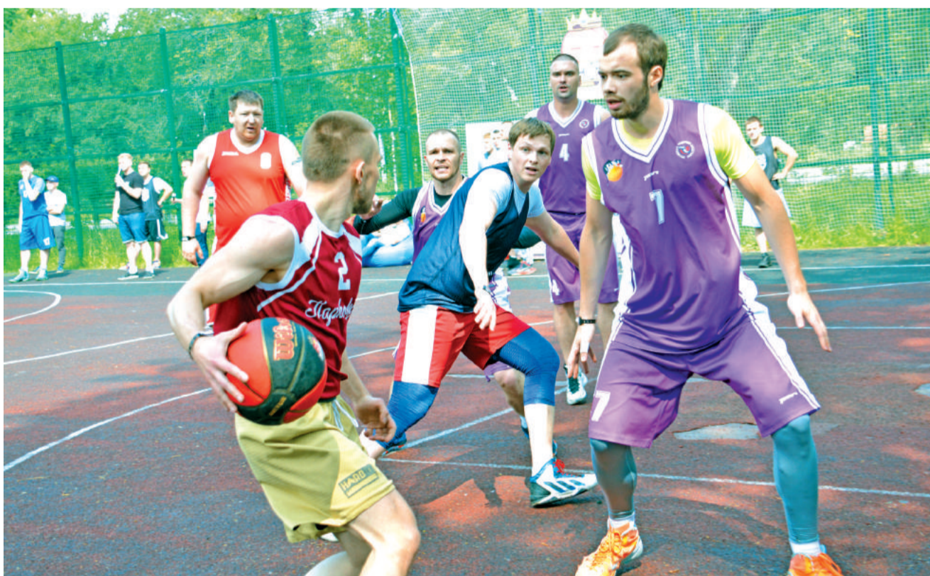
Не дать забить! Команда «Взрывная сила» – в защите.

По информации администрации ГО «Город Лесной».