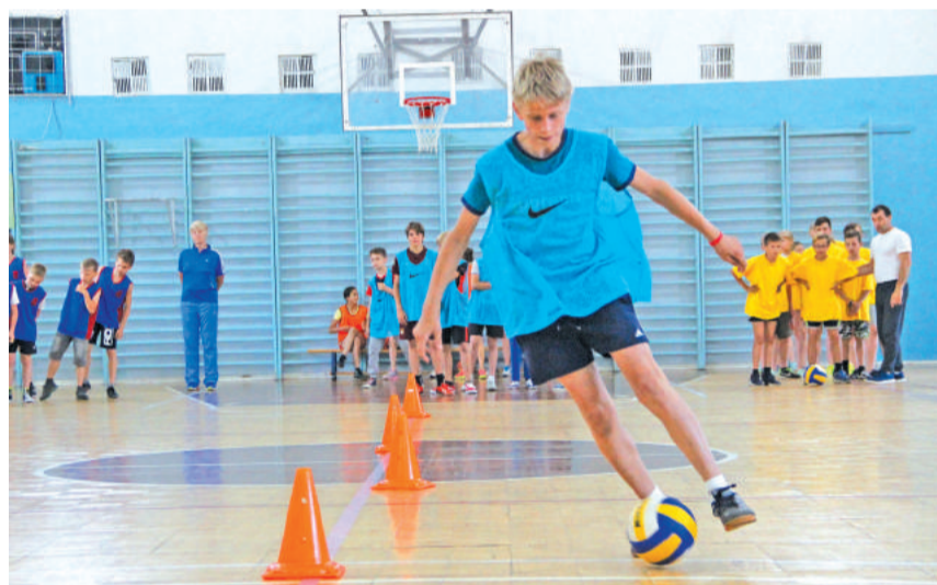
Ребята соревновались в ловкости и скорости, учились побеждать и достойно проигрывать.