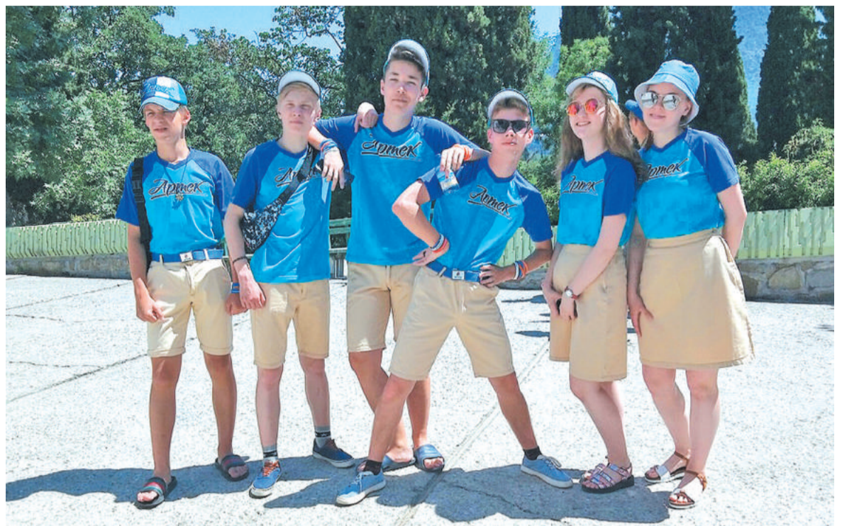
Юные «арлекинцы» в «Артеке».

Так же ребятам не хотелось уезжать из «Артека», где собрались 4 команды победителей и призёров «Те-Арт Олимпа» (было два третьих места) – из Лесного, Снежинска, Железногорска и Новоуральска. Все они и составили Театральный отряд лагеря «Лазур-