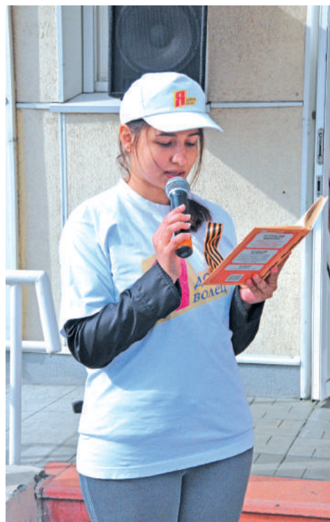
Волонтеры помогают библиотекарям в организации массовых мероприятий, акций.

– для тех, кто хочет по-новому взглянуть на привычные вещи! Здесь анонсируются волонтерские встречи, акции, проекты. Прими вызов – приходи в «Гайдаровку!» #библиотечныйчеллендж