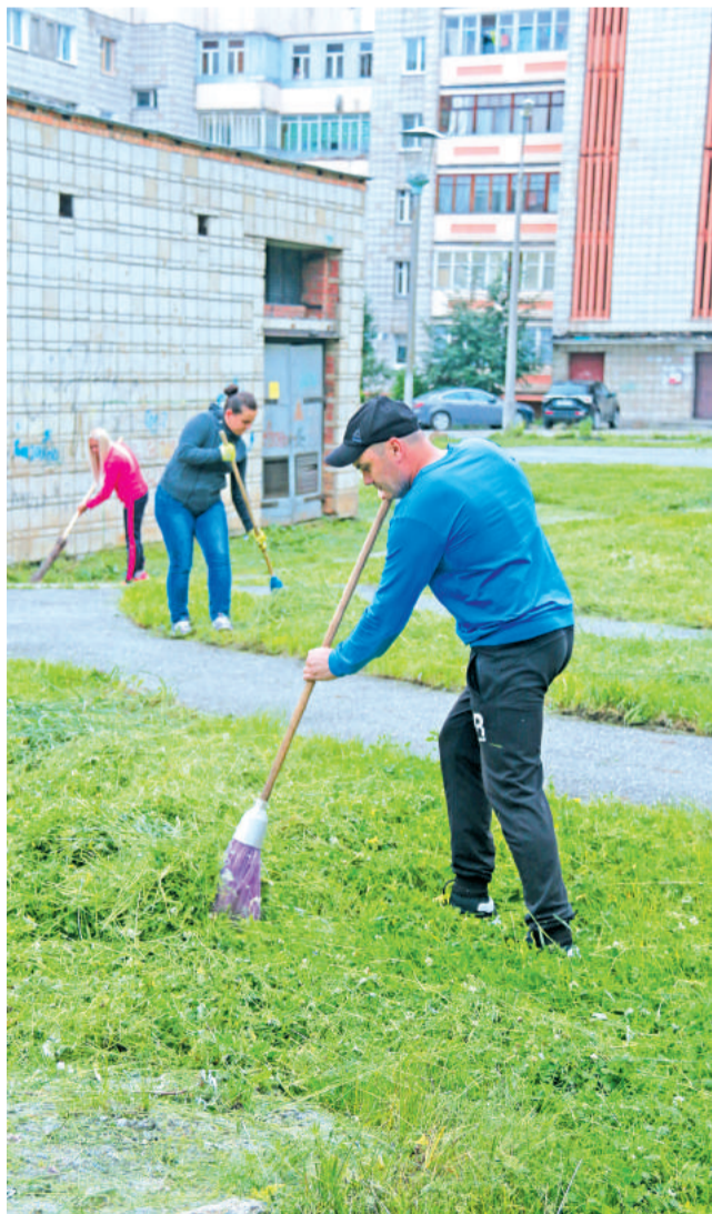
На дворовый субботник лесничане выходили семьями.

Какой же будет в итоге дворовая территория домов № 22 по улице Мира и № 83 по улице Ленина – узнаем совсем скоро. Реализация проекта завершится в сентябре текущего года.