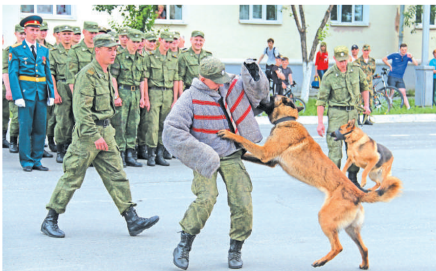
Показательные выступления бесстрашных военнослужащих подразделения кинологической службы.

Праздничные мероприятия, посвящённые юбилею, продолжились в минувшую субботу. Торжественное собрание в Детской музыкальной школе собрало в большом зале личный состав в/ч 3275, командование части, руководителей города, градообразующего предприятия. Поздравления с юбилеем, вручение наград, дипломов, благодарственных писем, подарков, проникновенные песни о России и задорные танцы – вот чем была наполнена встреча. Ну а финальным аккордом в череде торжеств стал вечер «От всей души».