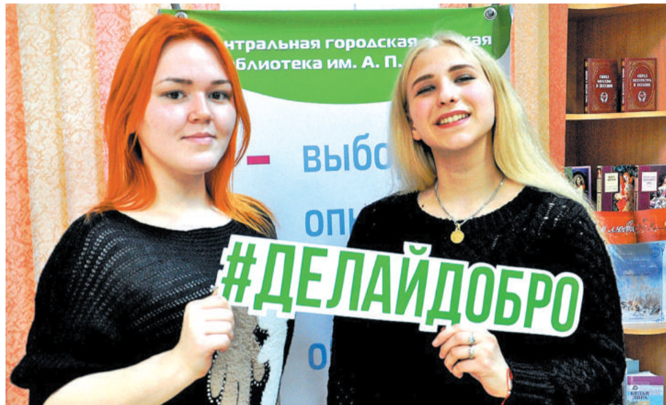
Умницы, красавицы, активистки – приглашают новичков в ряды волонтеров.

дел собралось немало. Самой социально важной, по мнению самих ребят, стала благотворительная акция «Добрая душа», во время которой всего за пару часов была собрана целая «ГАЗель» подарков для воспитанников детского дома.