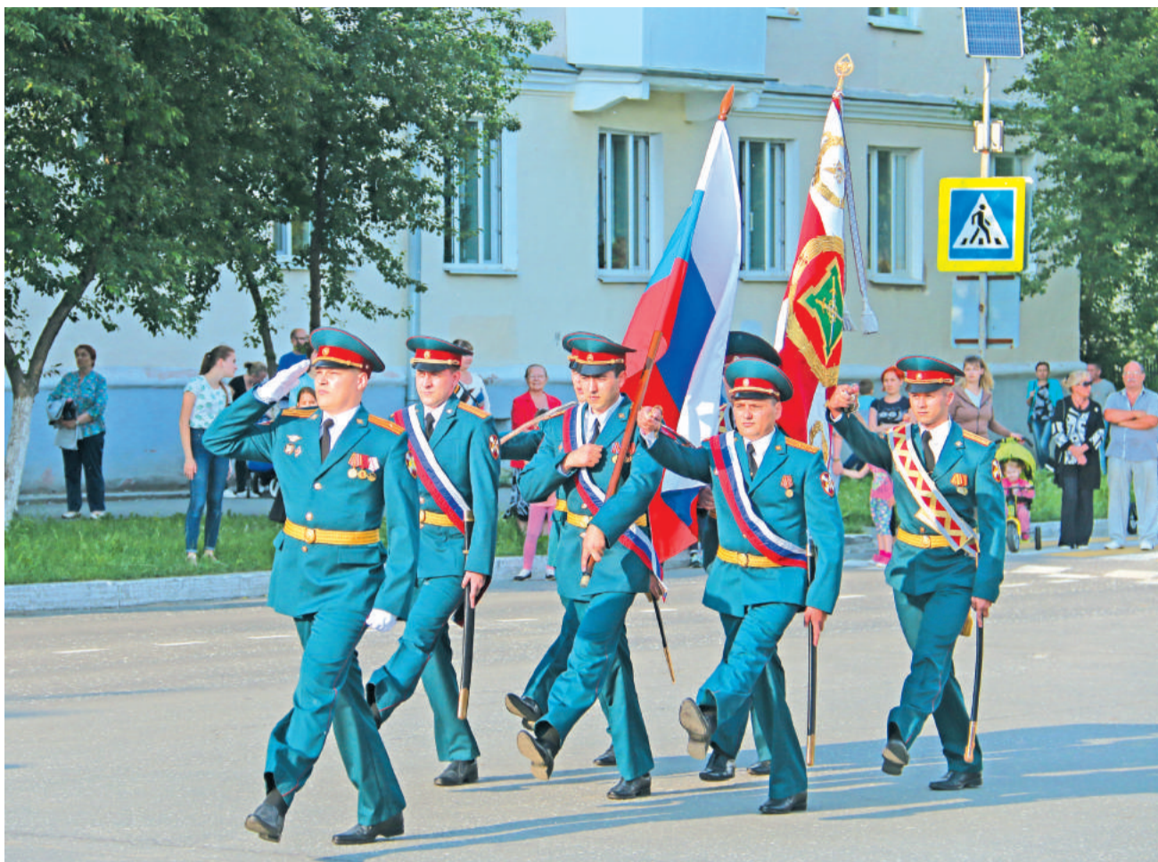
Почётно и торжественно – вынос знамени войсковой части.