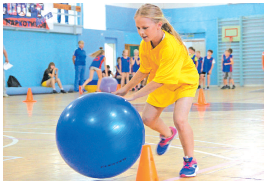
Приобщение к спорту, к здоровому образу жизни, воспитание чувства толерантности – одни из главных задач «Калейдоскопа национальных игр».

Спортивные встречи данного формата проводятся с целью формирования ценностей толерантности, патриотизма, сплочённости в детской и подростковой среде. Ребята – хоккеисты, гимнастки, баскетболисты, легкоатлеты, борцы – перевоплощались во время стартов в представителей разных народов, учились дружить, побеждать, достойно проигрывать, поддерживать товарищей.