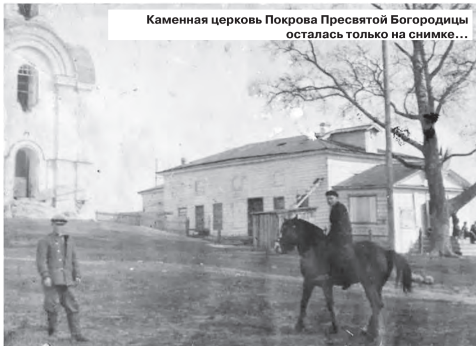
Каменная церковь Покрова Пресвятой Богородицы осталась только на снимке...