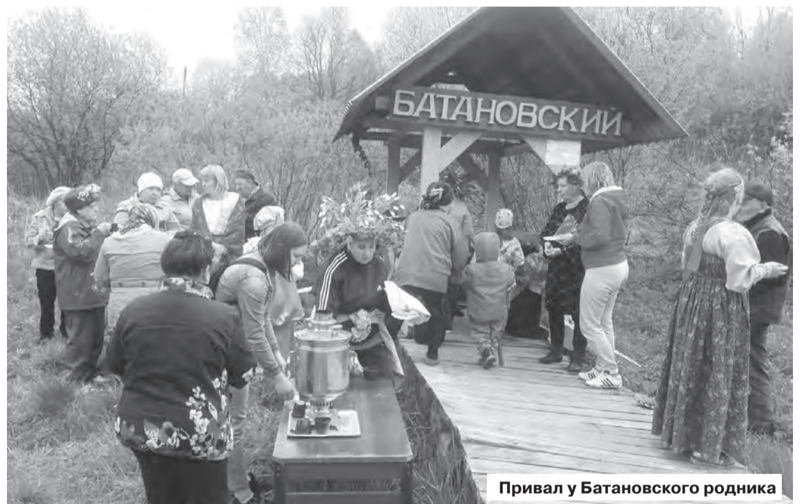
Привал у Батановского родника

КАТАНИЕ НА ЛОШАДЯХ И ПОНИ, АТТРАКЦИОНЫ, ФОТОЗОНА, КОНКУРСЫ, АКВАГРИМ, ШАШЛЫК, ПЛОВ, САХАРНАЯ ВАТА. С 11 ЧАСОВ ПРОДАЖА САЖЕНЦЕВ.