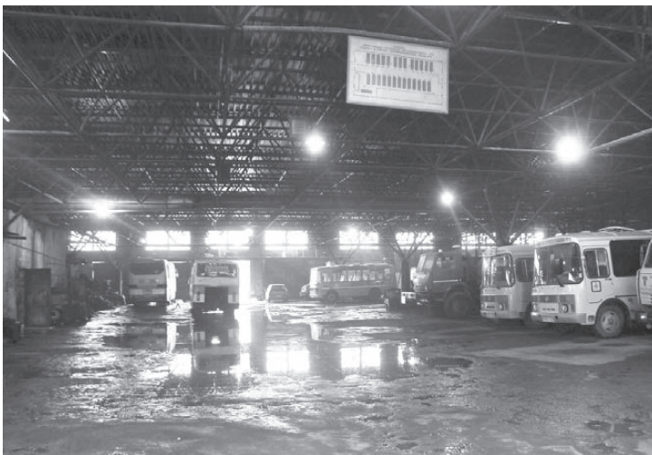
Дешевле построить новый ремонтный бокс, чем отремонтировать крышу в гараже. Автобусы будут стоять на улице.