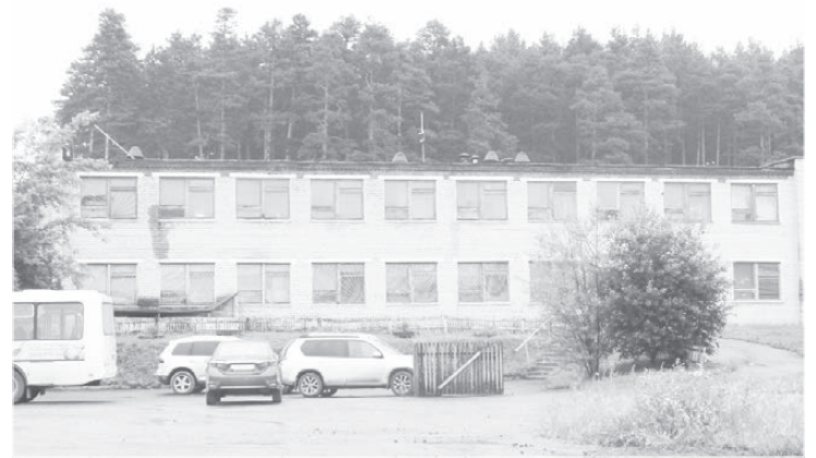
Административное здание сейчас занято лишь на четверть. Его тоже продадут.