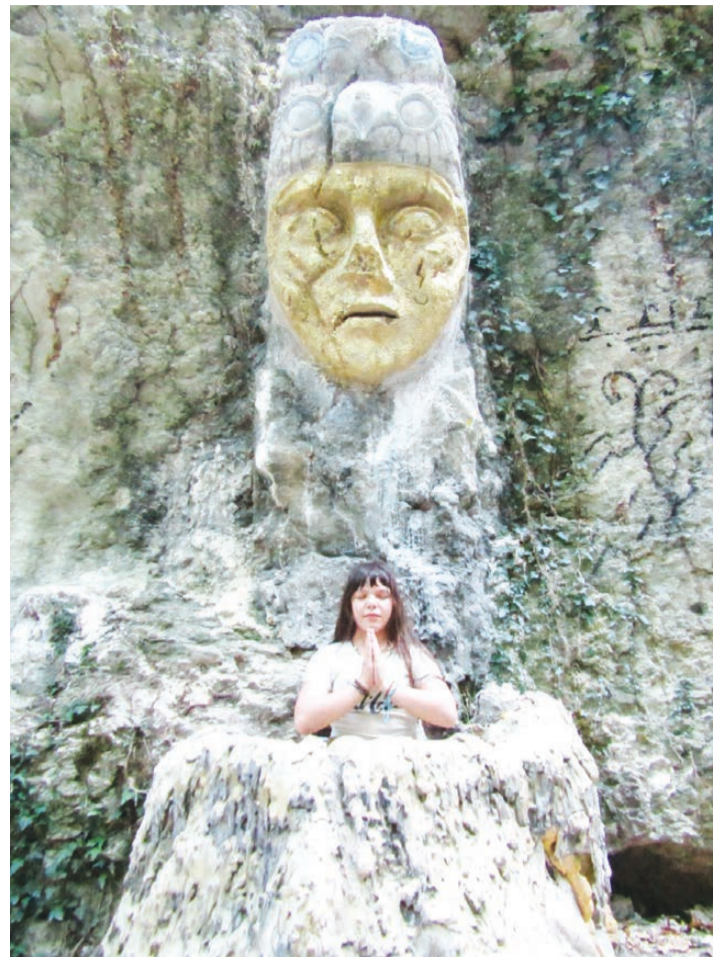
Лик Перуна с костровищем

Не пропустили и мы это удивительное место. За чашечкой чая вспомнили эпизоды фильма, представив себя актерами, сделали фото на память и отправились домой, поскольку пространство для ночлега здесь совсем неподходящее из-за большого скопления любопытных как и мы туристов.