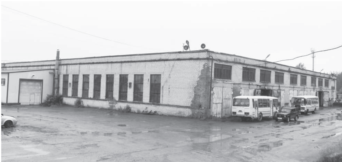
Будут проданы участки, на которых располагается АТП, общей площадью более 2 га