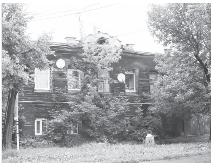
Общежитие на Быкова, 36, тоже планируют продать. Несмотря на проживающих в здании людей.

они хотят мало, а получить много. И начали ездить сами. Сократили излишний управленческий персонал, ввели контрольно-ревизионную службу. Как мы поняли, здесь было джентльменское соглашение – водители не получали зарплату, но руководство закрывало глаза на то что они кладут в карман собранные на маршруте деньги. И если раньше водитель при возил с рейса 10-15 тысяч, то теперь, после введения контроля, привозит 50 тысяч рублей. Постепенно удалось повысить зарплату.