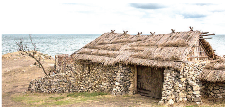
Декорации на Генеральских дачах

Туристу на заметку: Добраться до скифского подворья можно из Керчи в село Золотое, а затем по грунтовой дороге пешком ходом, или на авто до Генеральских пляжей. На гору Крокодил можно попасть из поселка Красный мак Бахчисарайского района. Неаполь Скифский находится в центре Симферополя. Доехать можно на маршрутках № 24,85,108.