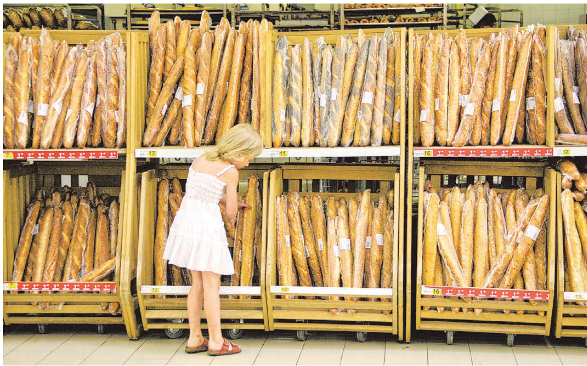
ПОТРЕБЛЕНИЕ ХЛЕБНЫХ ПРОДУКТОВ В РЕГИОНАХ УРФО НА ДУШУ НАСЕЛЕНИЯ В ГОД, КИЛОГРАММЫ

— Картофельная палочка попадает в зерно из почвы, а развивается там, где тесто недостаточно «выбраживается». Если с хлебом все в порядке, значит, технологии соблюдаются или хлебопеки добавляют специальные улучшители, ускоряющие процесс брожения. Ведь выпекание традиционным способом занимает около восьми часов: три часа поднимается опара, еще два уходит на замес теста и так далее. С улуч-