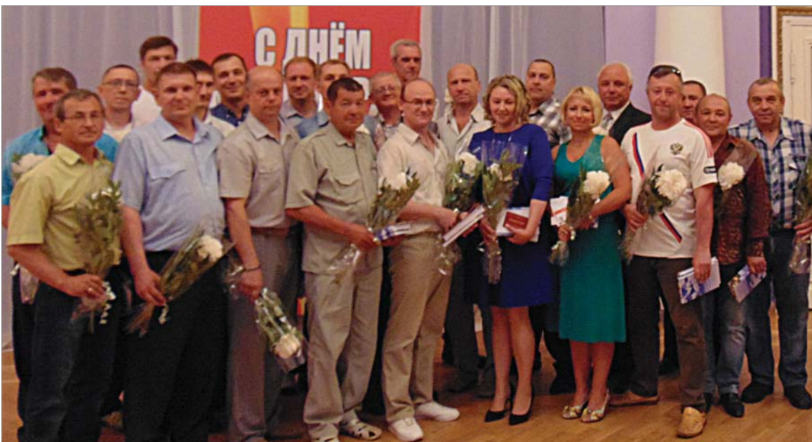
Ветераны труда завода-2018.