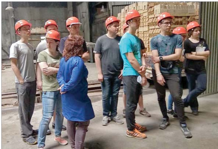
Второкурсники УрФУ во втором цехе увидели весь технологический процесс.