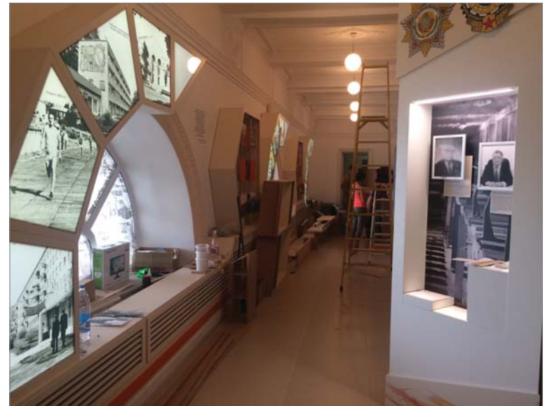
12 июля. Последние штрихи.

Вышесказанные мысли прописаны самой жизнью. Они заставляют нас начать работу над систематизацией и формированием материала для полного восстановления исторической памяти.