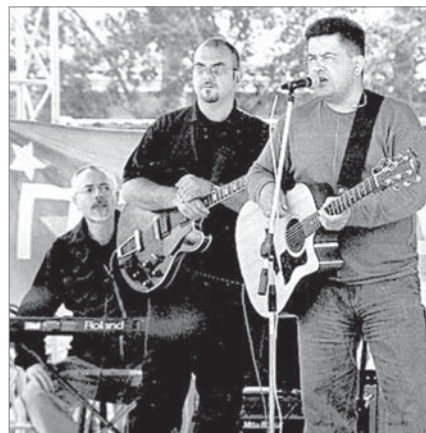
«Давай за!» - в исполнении группы «Любэ» звучала на стадионе в 2002-м.

Поздравляла динасовцев с профессиональным праздником в 2005 году группа «Доктор Ватсон», в следующие годы к нам при-