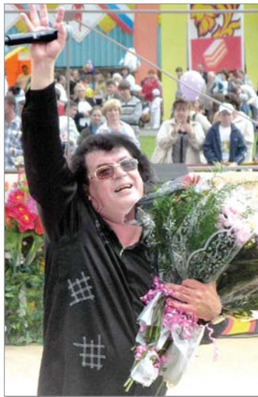
Игорь Корнелюк пел для динасовцев в 2011-м.

Прошедшие годы и минувшие праздники подарили динасовцам много запоминающихся встреч.