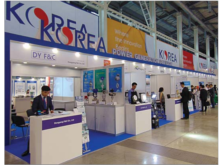
Корея привезла на выставку разработки более 100 компаний.