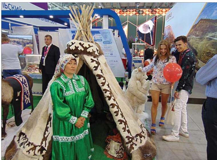
Визитная карточка Ямало-Ненецкого автономного округа.