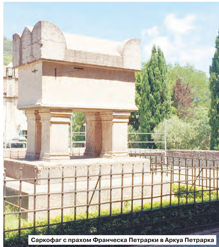
Саркофаг с прахом Франческа Петрарки в Арка Петрарка