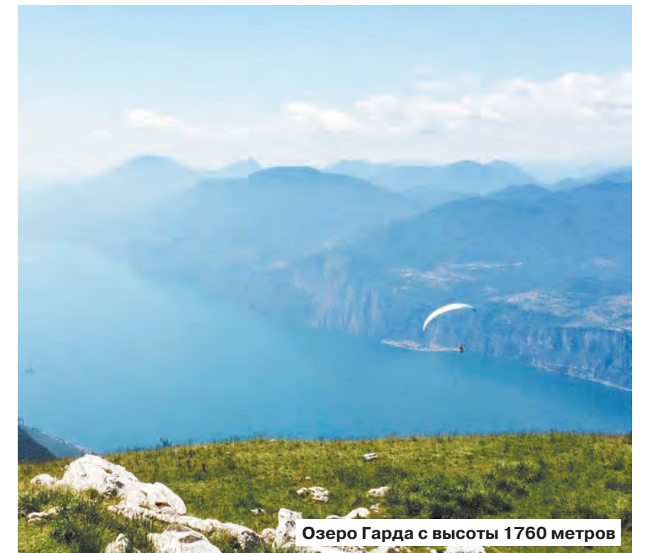
Озеро Гарда с высоты 1760 метров