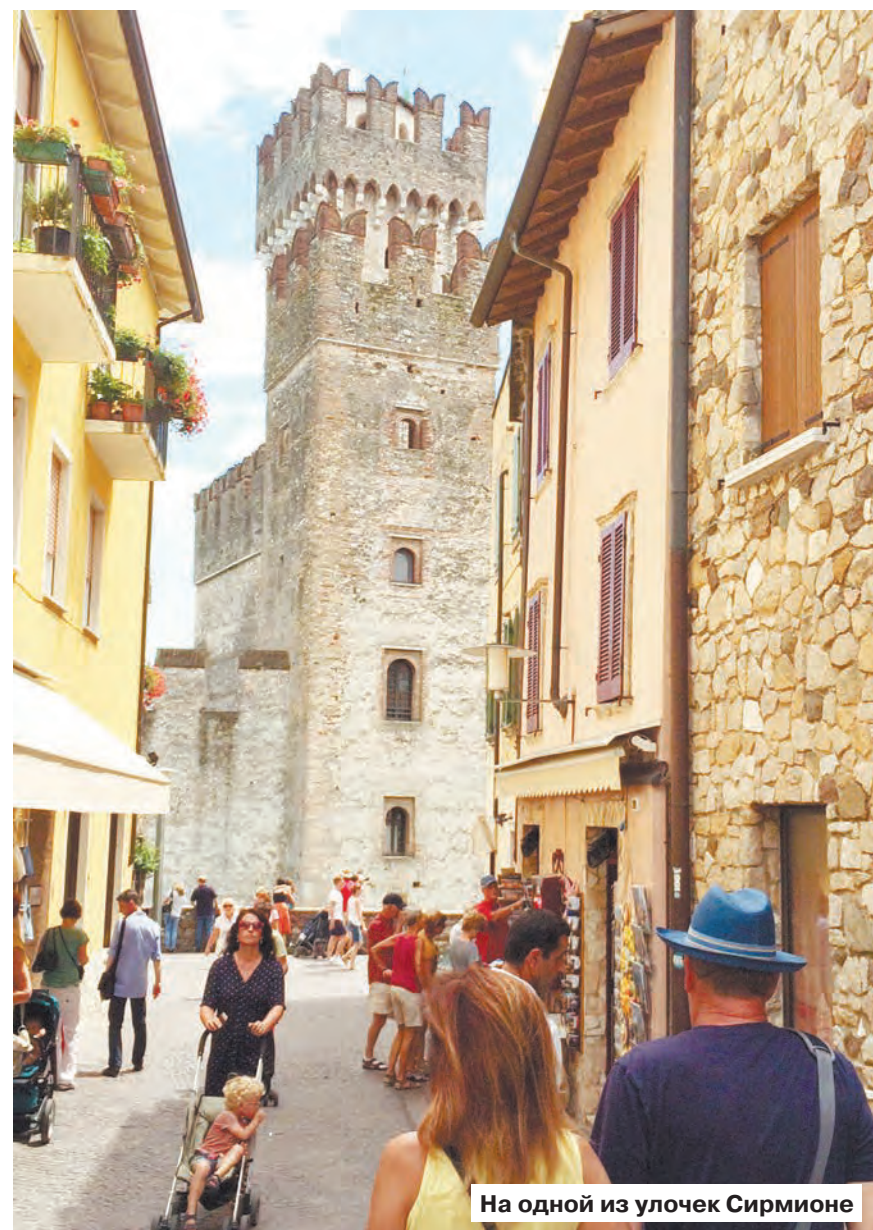
На одной из улочек Сирмионе