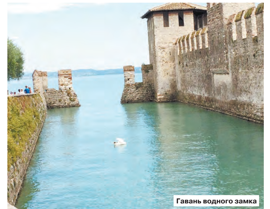
Гавань водного замка