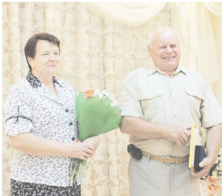
Королевы. 2018 год.

Медаль «За любовь и верность» вручается ежегодно, на сегодняшний день этих наград в Сысертском районе вручено шесть.