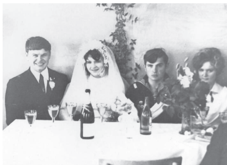
Королевы. 1973 год.