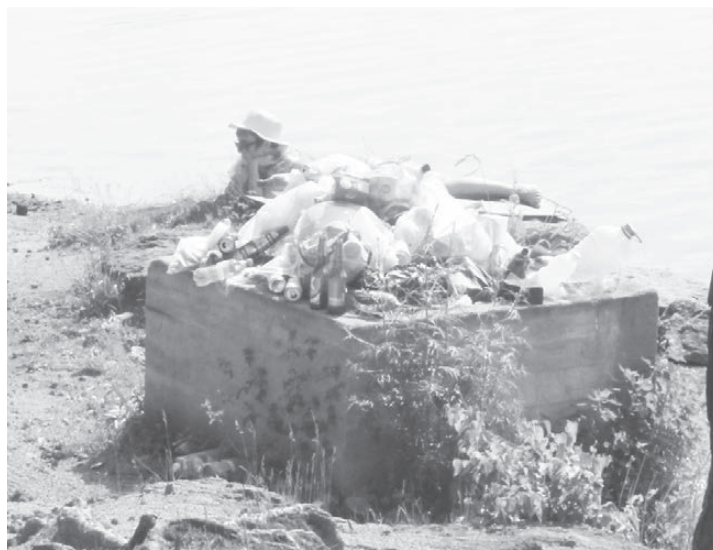
В Кашино люди загорают рядом с мусорными кучами

купания в Черданцево. Люди попадают сюда через дыру в заборе. На пляже откровенно грязно, вход в воду не пологий, а крутой, уже через метра два глубина по пояс. Тем не менее люди вынуждены купаться здесь – а где же еще? За нескончаемой чередой подъезжающих и отъезжающих машин с грустью наблюдают местные жители, чьи дома находятся прямо возле стихийного пляжа. Они вынуждены дышать не чистым воздухом, а выхлопными газами.