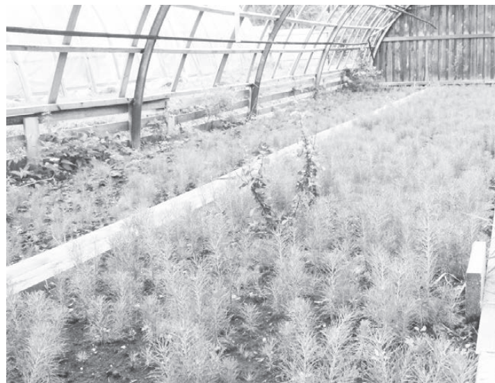
Ну а этим уже год! Еще через год поедут жить в лес.

Кто враг сосенок-мальшек в лесу? Птицы, которые могут за-