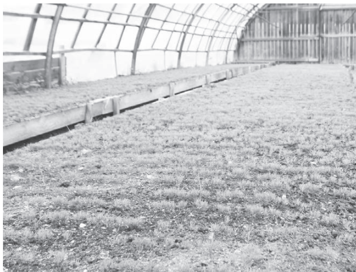
Этим сосенкам 2 месяца

Нам показали двухмесячные сосенки, которые высадили в мае - это травинки, которым, кажется, опасен любой порыв ветра.