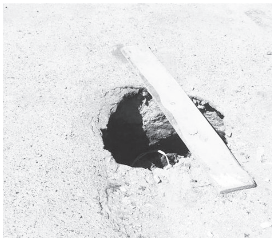
Дыра в Сысерти