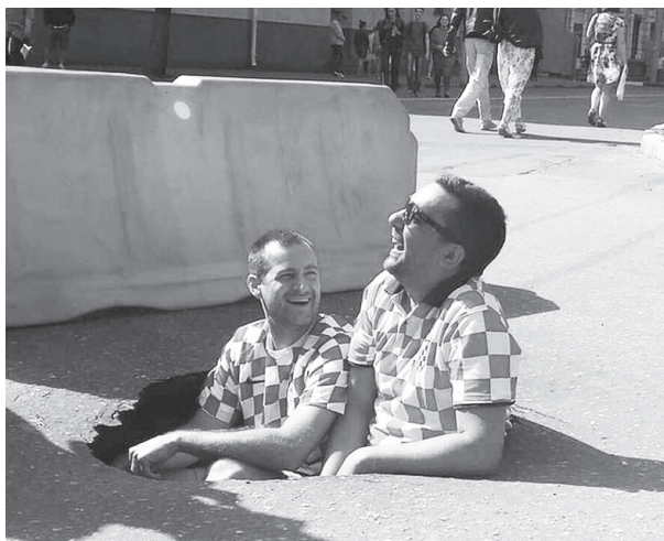
Дыра в Нижнем Новгороде.

У нас аналогичная ситуация: дыра в асфальте обнаружена возле дома №33 по улице Орджоникидзе. Так как хорватские болельщики к нам не приехали, то дыра простояла открытой недели две, а потом ее прикрыли фанеркой. Но разве это выход? Дыра по-прежнему остается опасной и для людей, и для машин. А еще на таких фанерках любят прыгать дети, чтобы проверить - сломается или нет. Ждем хорватов?