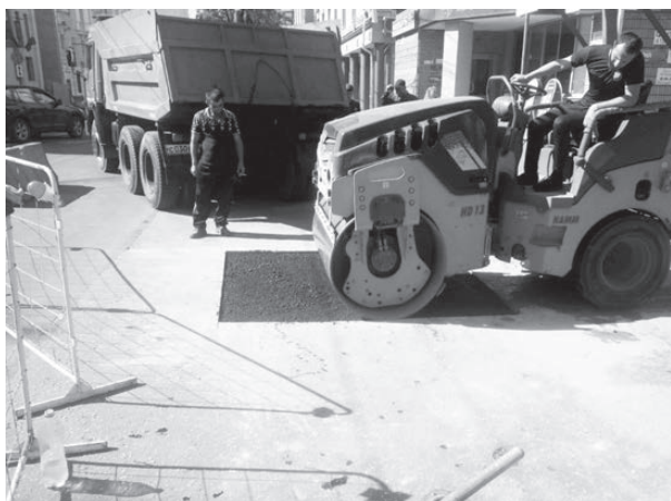
Ремонт дыры в Нижнем Новгороде