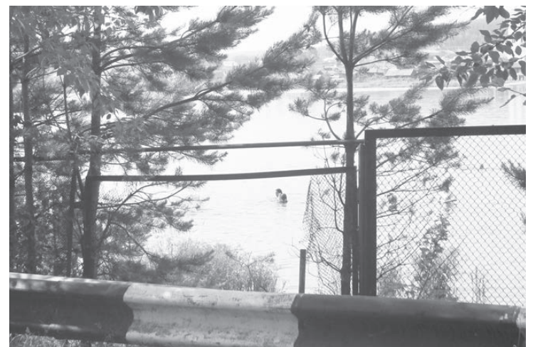
В Черданцево на пляж попадают через дыру в заборе