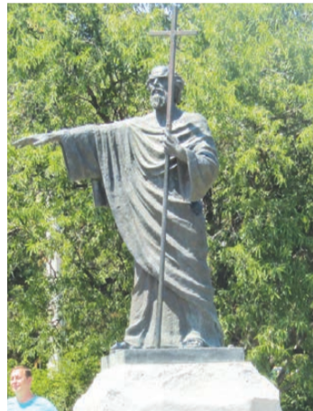
Памятник князю Владимиру

Разумеется, на эту землю любили нападать турки, скифы, а позднее на Херсонес совершали набеги печенеги, хазары, киевляне. «Битвы за Севастополь» тех времен длились до тех пор, пока сам князь киевский Владимир не решил «подружиться» с Византийской империей. В 988 году, затеяв политическую интригу, ему удалось взять город, принять крещение и жениться на вдове византийского императора Анне. Кстати, ей было 25 лет,