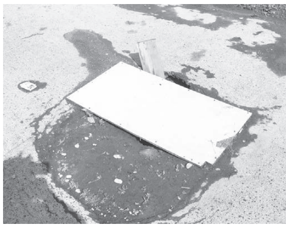
Ремонт дыры в Сысерти