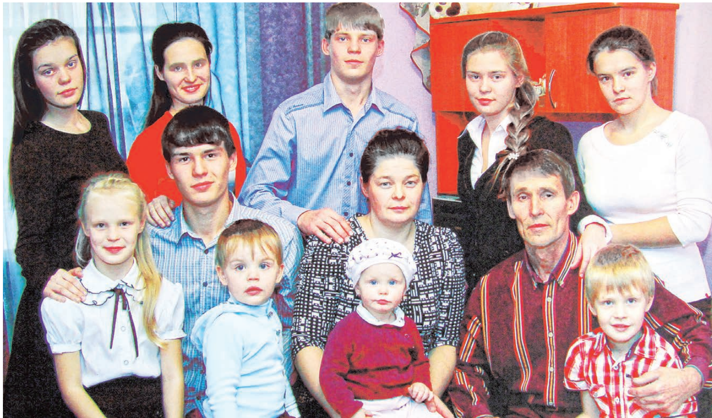
СЕМЕЙНЫЙ АРХИВ МАКЕЕВЫХ

Многодетная жительница Кургана поделилась секретом счастливой жизни