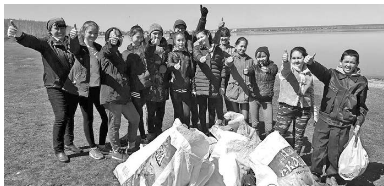
Аргаяшцы собрали более 40 тонн мусора.