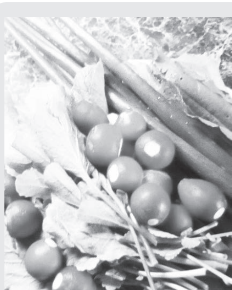
Редис, уже не тепличный, вырос на славу, влаги было достаточно, солнышко не досаждало, во всё можно найти плюсы.

Добавьте в раствор при подкормки золы и суперфосфата, тоже самое можно сделать, если вы подкармливаете настоем травы. Бочку набивают травой, дают настояться не менее 10 дней, если добавите в бочку немного дрожжей или черствого хлеба, то хватит и 3-4 дней. Литр настоя разводите в ведре воды и устройте огурчикам пиршество. Отблагодарят несомненно!