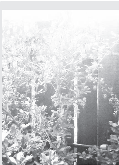
Барбарис отцвел, плодов много, без плова не останемся.