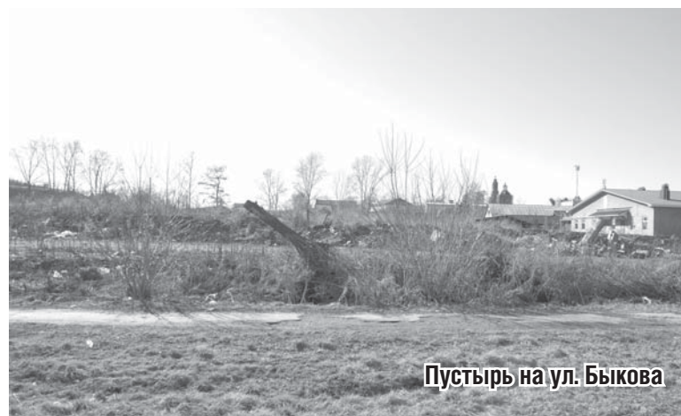
Пустырь на ул. Быкова