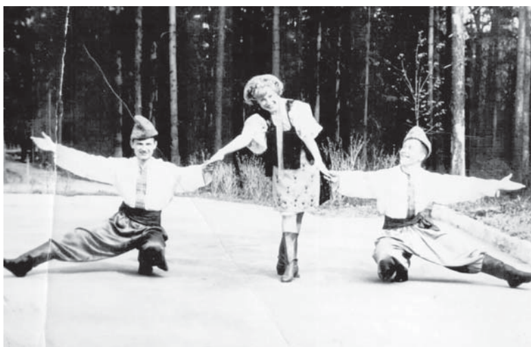
Василий в ансамбле

Юлия Воротникова.