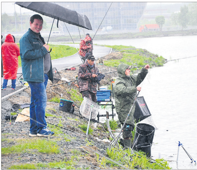
Всего на турнире было 8 человек.

После соревнований все гости и участники турнира отведали горячей ухи. Правда, из рыбных консервов.