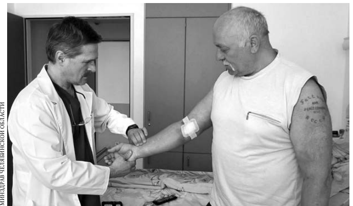
Сложнейшая операция свелась к проколу в области локтя.