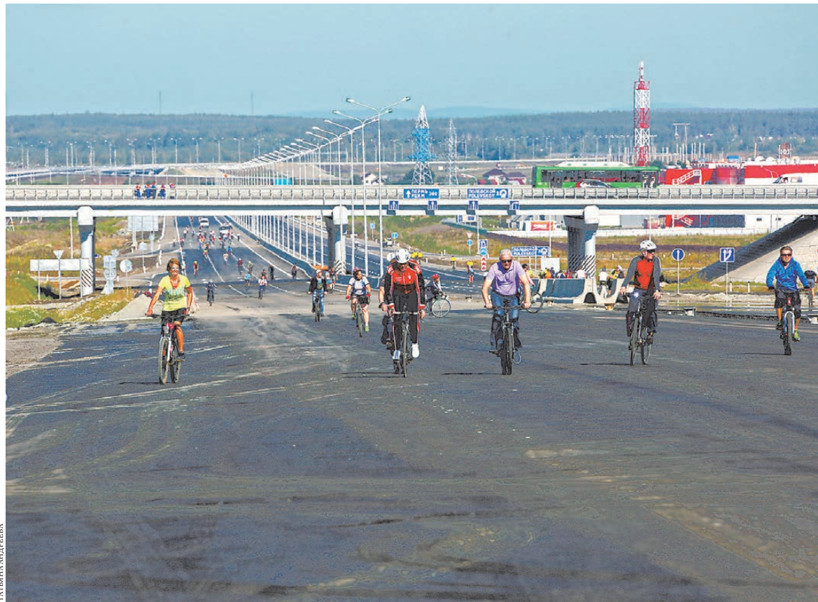
На строительство участка ЕКАД от поселка Медного до Полевского потрачено 256 миллионов рублей.

Этому коллективному саду не повезло вдвойне: он находится на быв-