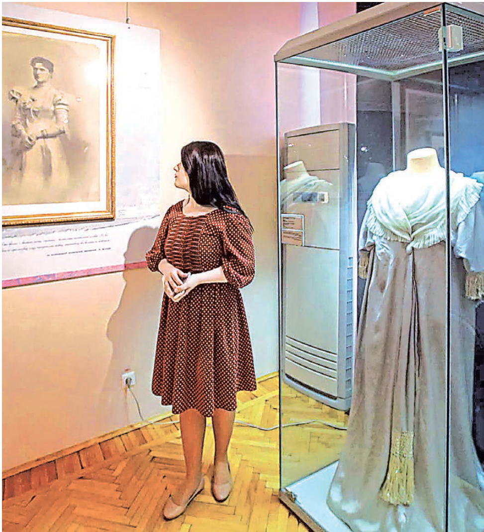
В этом шелковом платье Александру Федоровну видели только домашние.

Екатеринбуржцы узнают о частной жизни семьи Николая Второго