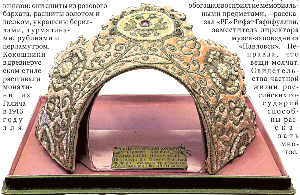
Кокошники в древнерусском стиле расшивали монахини для торжеств в честь 300-летия дома Романовых.

Что касается драгоценностей, то на выставке есть два кокошника великих княжон: они сшиты из розового бархата, расшиты золотом и шелком, украшены бериллами, турмалинами, рубинами и перламутром. Кокошники в древнерусском стиле расшивали монахини из Галича в 1913 году для