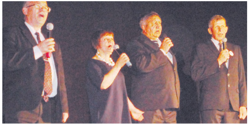
Руководители социальных учреждений Берёзовского вместе спели: «Мы желаем счастья вам».

Глава Берёзовского в приветственном слове отметил, что сейчас со стороны государства делается очень много для лиц, нуждающихся в социальной защите.