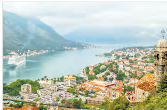
Крупнейший туристический центр Черногории знаменит своими песчаными пляжами, ночной жизнью и прекрасной архитектурой

либо строили в Черногории маленькие виллы, чтобы обеспечить себе тихую, спокойную, безбедную старость, занимаясь туризмом, что мы и наблюдали на протяжении всего отдыха. Хозяева виллы, где мы жили, сами вели непринужденный образ жизни с друзьями и застольями, но не в ущерб отдыху туристов. Они всегда держались обособленно, оказывая должное уважение и внимание гостям своего дома.