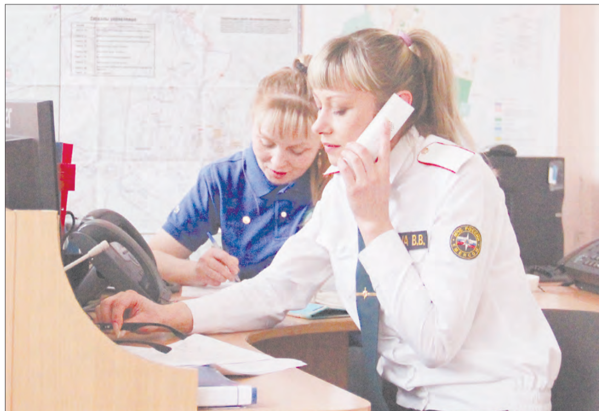
Дежурные операторы городской Единой дежурно-диспетчерской службы. С января 2018 года ЕДДС вошла в состав нового казённого учреждения — «Центр гражданской защиты»

По результатам судебного разбирательства 22-летний поделщик приговорён к реальному сроку лишения свободы с отбыванием наказания в колонии-поселении сроком в 3 года 6 месяцев. Его 32-летний поделщик получил условный срок в 2 года 6 месяцев. Ему ещё предстоит выплатить штраф в 50 тыс. руб. В прокуратуре Берёзовского отметили, что в отношении более старшего поделщика суд прекратил дело по эпизоду с вымогательством. Потому что он и потерпевший примирились.