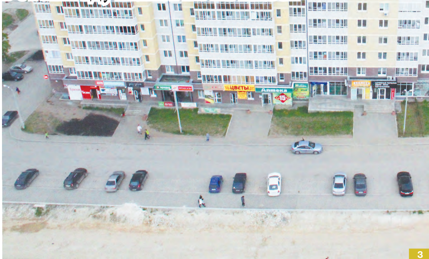
Граница участка под домом № 9 по ул. Восточной проходит по тротуарам у газона. Место, где стоят автомобили, власти назвали временной парковкой, но при этом ищут варианты её частичного сохранения.

Неоднократно обещанное строительство участка улицы в этом году может не начаться