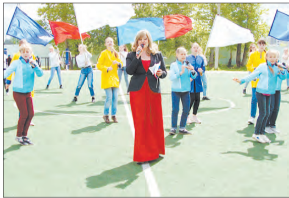
Спортивными танцами открывался детский межмуниципальный турнир по мини-футболу.