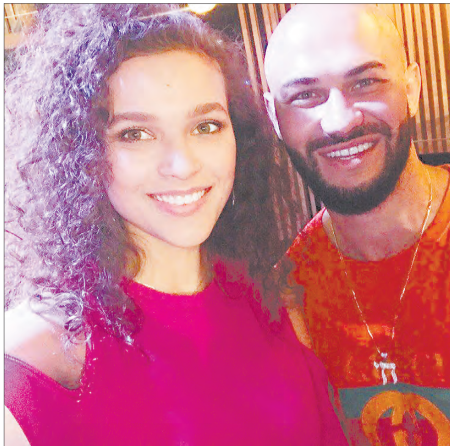
С Джиганом. Проект на «Русском Радио» подарил березовчанке встречу со многими звездами российской сцены