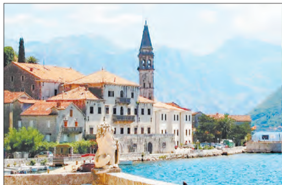
Будва основана 2500 лет назад, является одним из самых древних поселений на берегах Адриатического моря