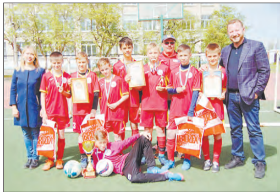
После заслуженной победы — коллективная фотография команды и организаторов турнира.